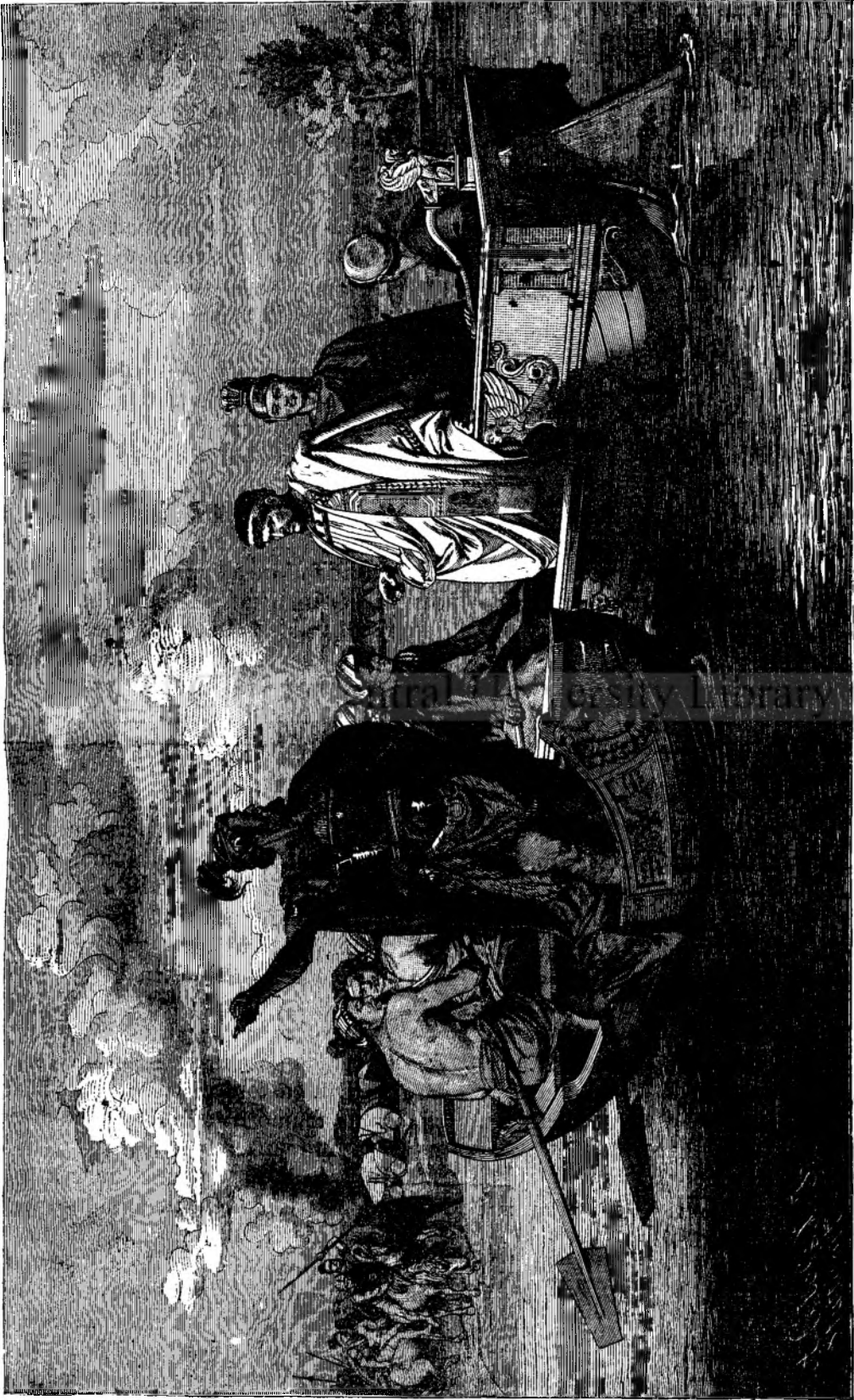
Lucullus pléca la resbelu.