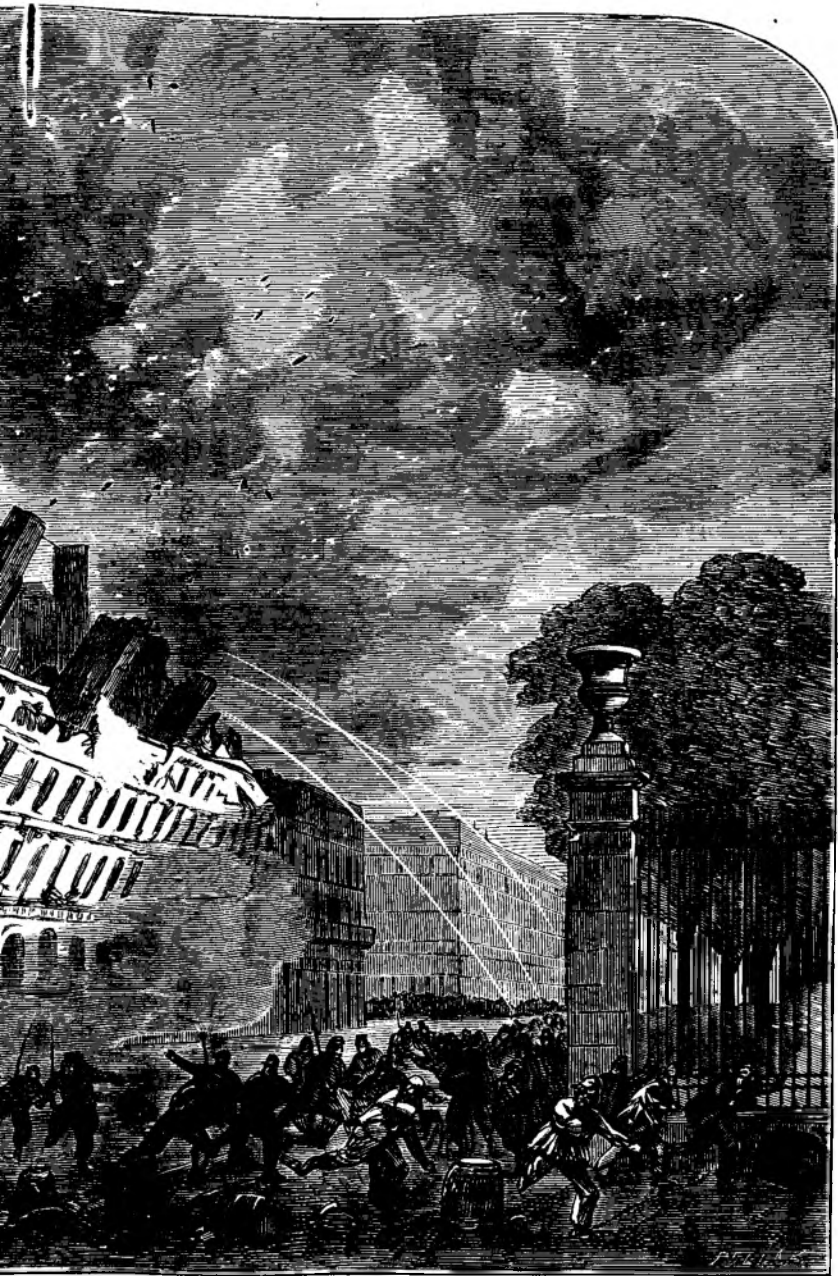
Rivoli in Paris.