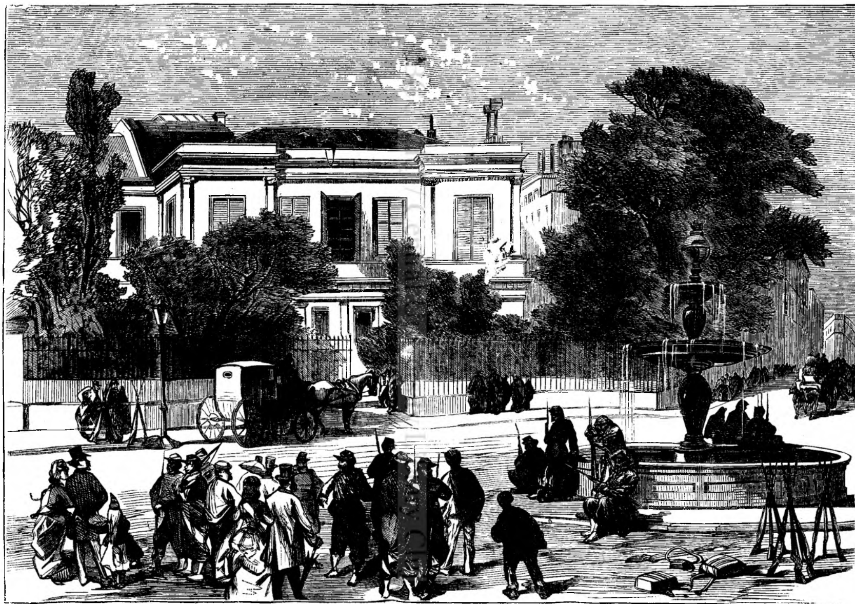
Cas'a lui Thiers în Paris înainte de ruinaea ei.