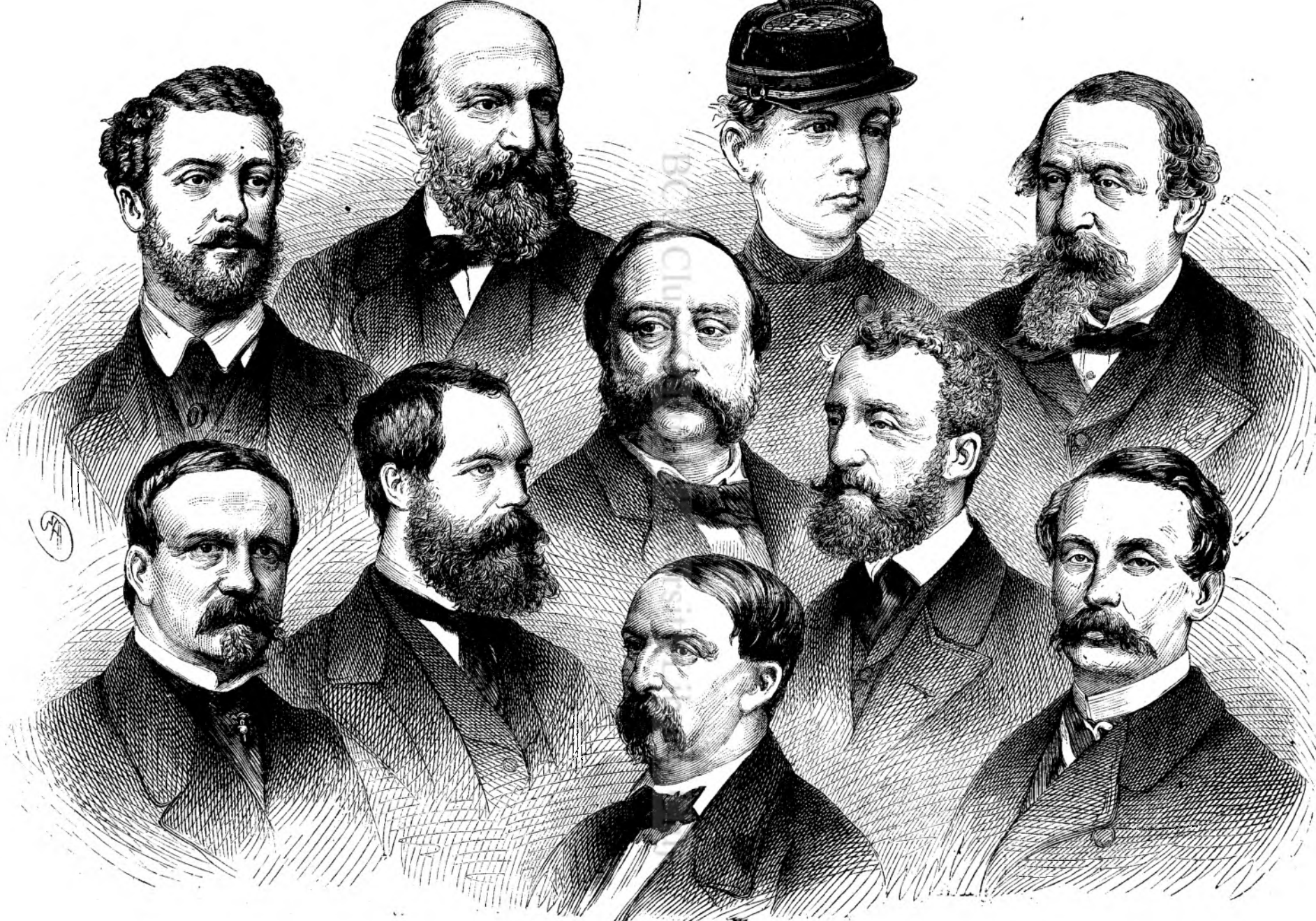
Principele de Alençon.