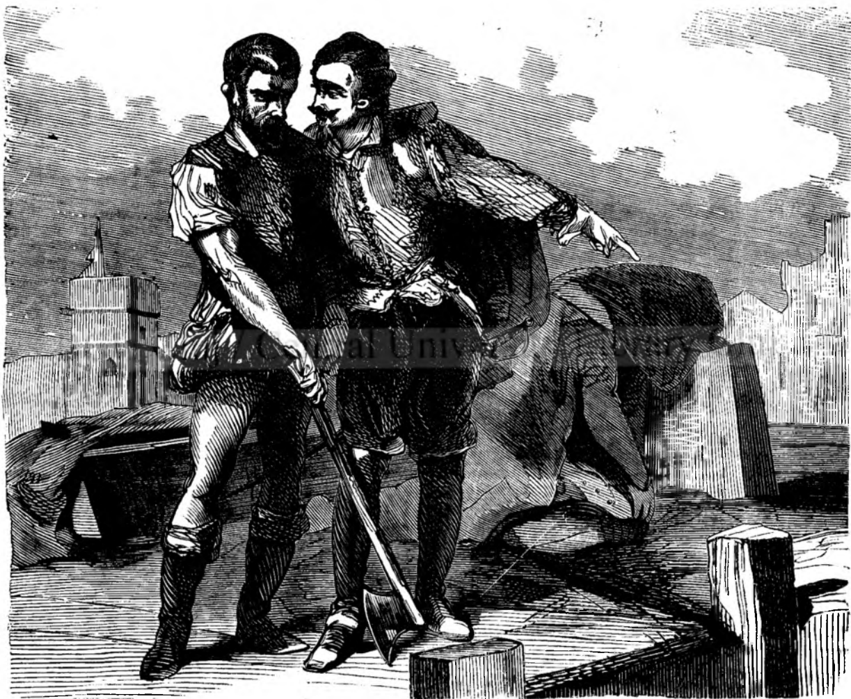
Calculu tinea securca in mana sa robusta. („Cavalerii Noptii“ pag. 264.)

Caletoriulu, ce pe-acolo se 'ntemplá ca sê strabata, Si-opriá a sale pasuri imbetatu de-alu loru odoru, Admirá asta gradina cu flori bele tapisata, Si-ar fi vrutu ca sê remana pururea 'n midiloculu loru.