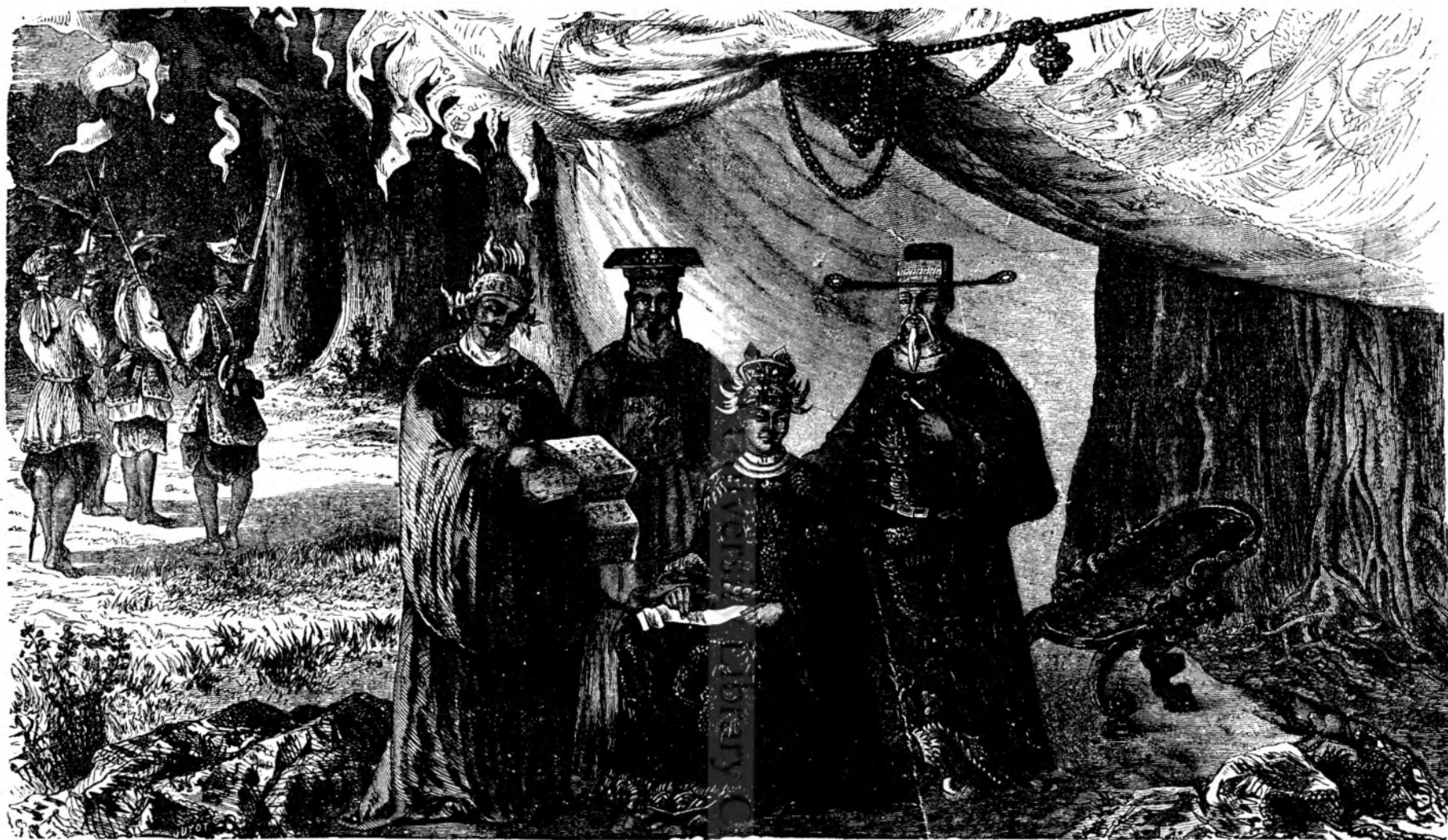
REGELE DE COCHINCHINA SI CURTEA SA.