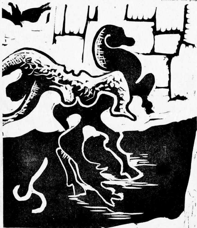
Gravură de S. PERAHIM