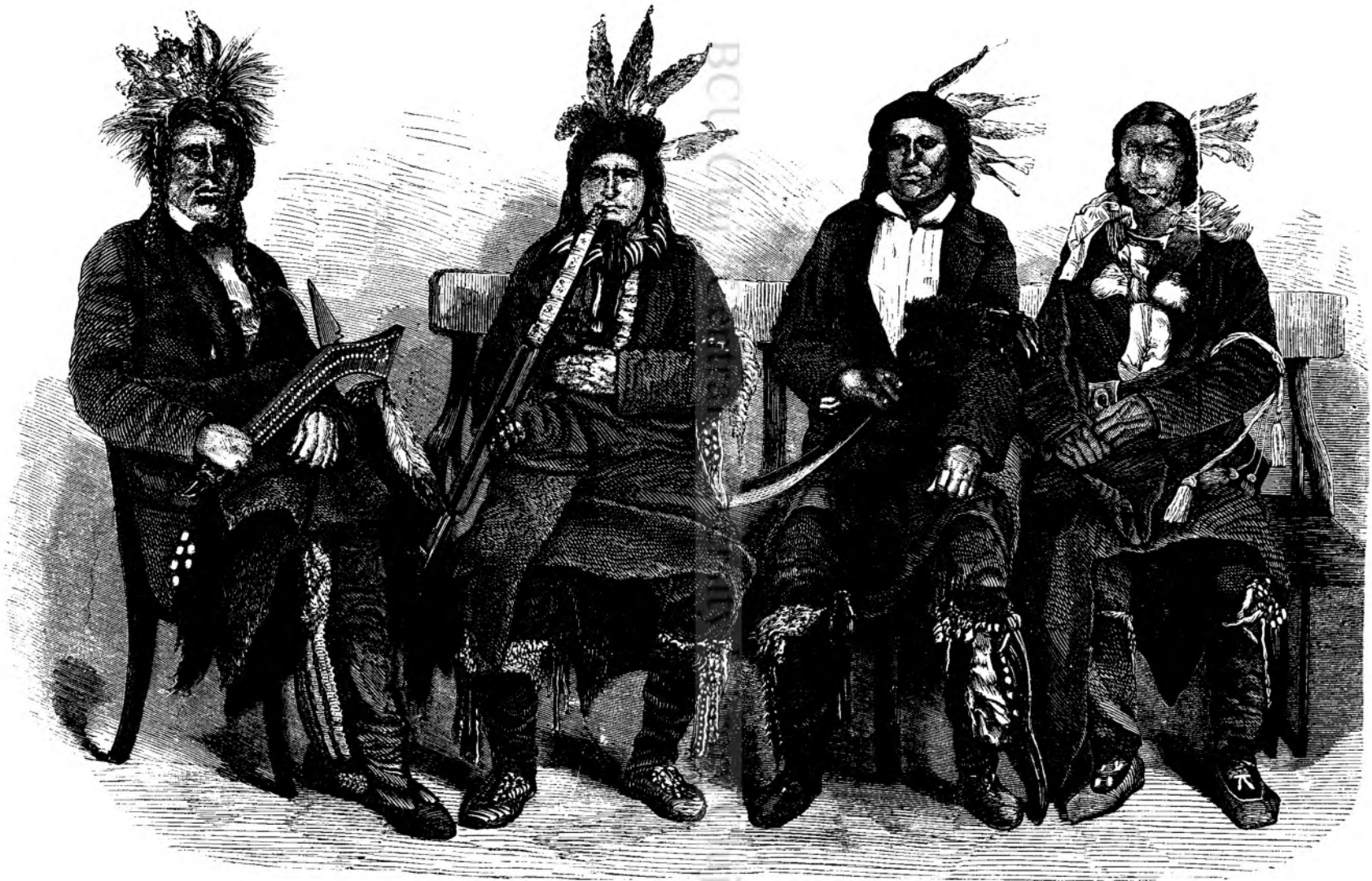
GUVERNATORI INDIANI IN NORD-AMERICA.