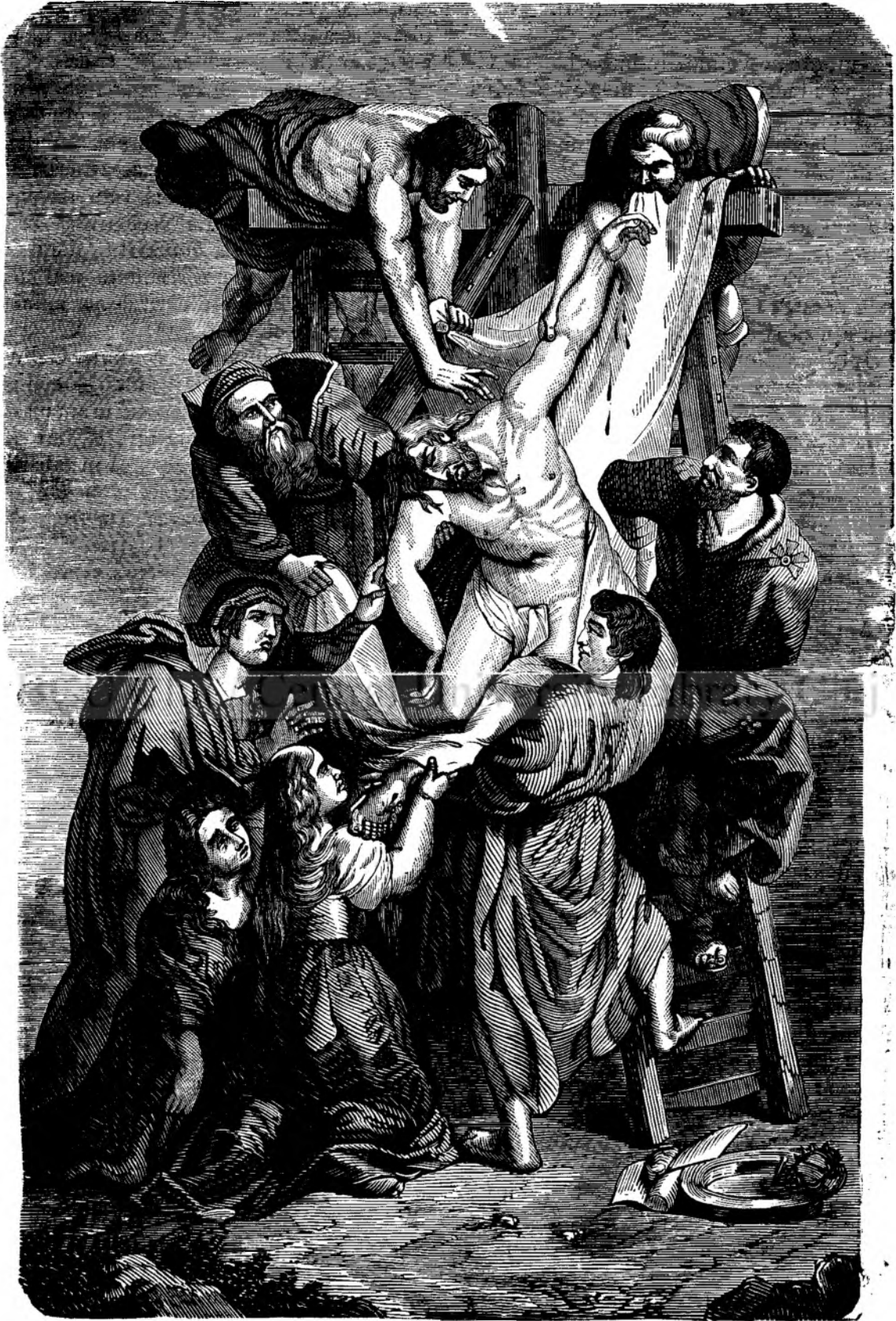
LUAREA LUI ISUSU DE PE CRUCE.