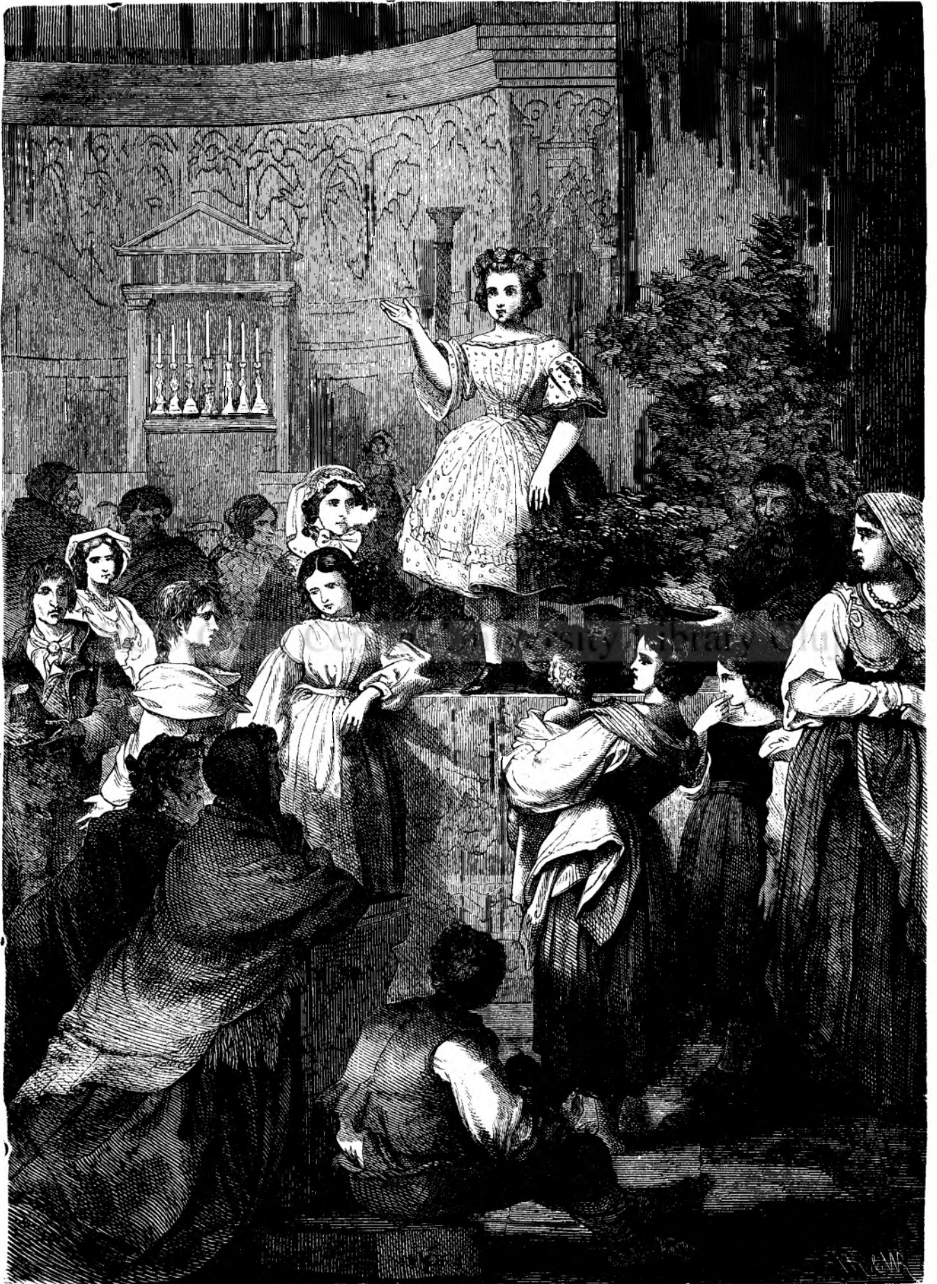
Serbătorea copileloru in Rom'a.