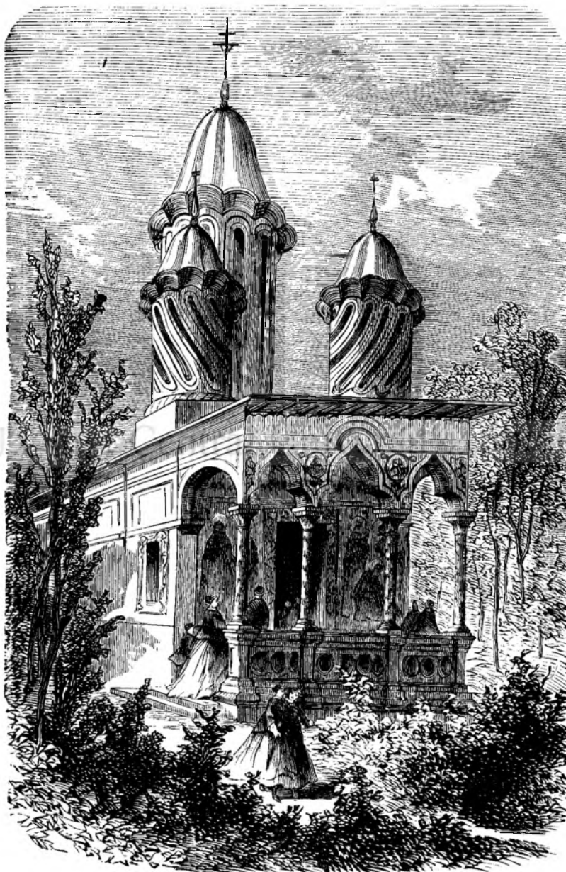
Pavilonulu Romaniéi la espusetiunea din Parisu.

tului nadusiâ ver-ce aspiratiune mai liberala, erá unic'a, scôla politica si literaria a totororu romaniloru, si numele fundatoriului si redactoriului ei, numele lui Bariliu veneratu pe tiermurii Milcovului , ca la Ternav'a si Tis'a ; Organulu luminarii de Cipariu , un'a din cele mai insemnate foie literarie, ce au existatu candva la romani. Dintre cari de si unele abié cunoscute dupa nume.