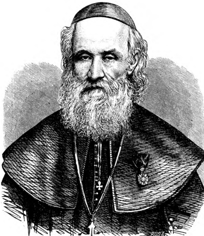
Alesandru Sterca Siulutiu.

Si totusi ce minune! Dintre toti Romanii nicairi nu s'a desvoltatu mai de graba spiritulu