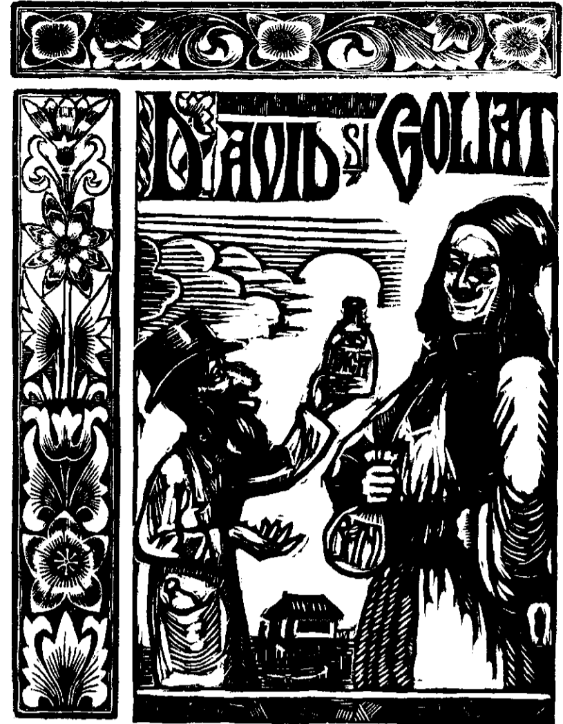
Xilografie de I. Gheorghiu.