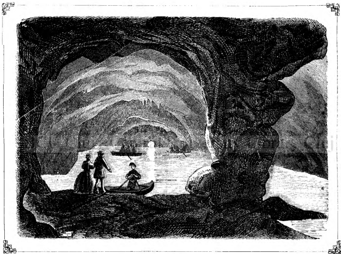
Pescerea vêneta de la Capri aprópe de Neapole. (Vedi pag. 259.)

— Pana candu vei siedé totu in arborele acesta, ti-'a fi frigu, apoi neci n'ai mancatu de eri; fi numai in liniste, cá de adi inainte ti-'oiu