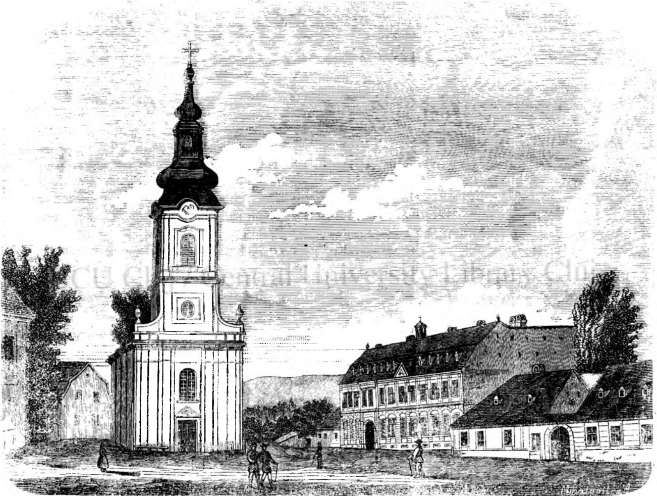
Piat'a si gimnasiulu gr. c. romanu de Beiusiu. (Vedi pag. 208.)

Mustafa urmà betranului si intrà in paradisulu stralucitu unde lu asceptá corulu dinelor care de care mai frumósa si mai placutu suridietóre, dar' tóte frumsetiele acestora nu ajungea cu tipulu dragalasiu, cu fati'a incantátóre