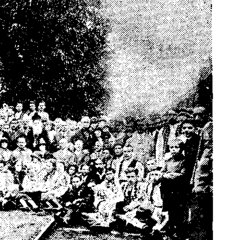
UN GRUP DE EXCURSIONIȘTI ȘI AUTORITĂȚILE DIN ZĂLAU

sonm profund, procedam în cea mai mare grabă la pregătirile de plecare. Cum afară ploia încă, după ce aranjăm nota de plată a otelului, într-o trăsură de orăz respirăm aerul curat al dimineații, îndreptându-ne spre gară.