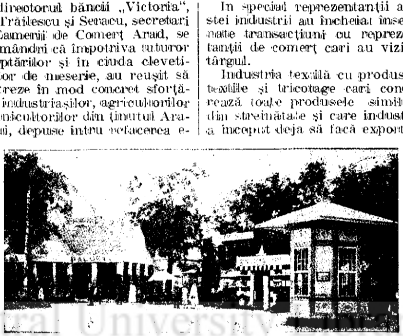
PAVILIOANE DELA TÂRGUL DE MOSTRE DIN ARAD