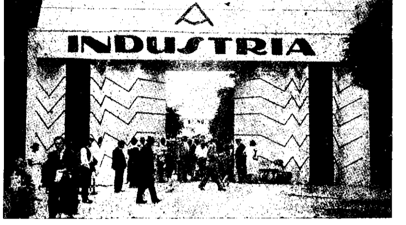
O INTRARE LA TÂRGUL DE MOSTRE DIN ARAD

Xanthis, în 28 Martie 1925. Zi de târg. Se vând scurătorii de lemne de foc aduse pe măgări din munţii apropiaţi, stambă lefînă, stropiuri pentru uted răsadniţele în care a fost semănat tutunul, sape, coşuri, merinde. Greci, Turci, Armeni, Bulgari, Sârbi, Albaneji, Cutovalni se înghesuie pe strada unde se ţine acest târg.