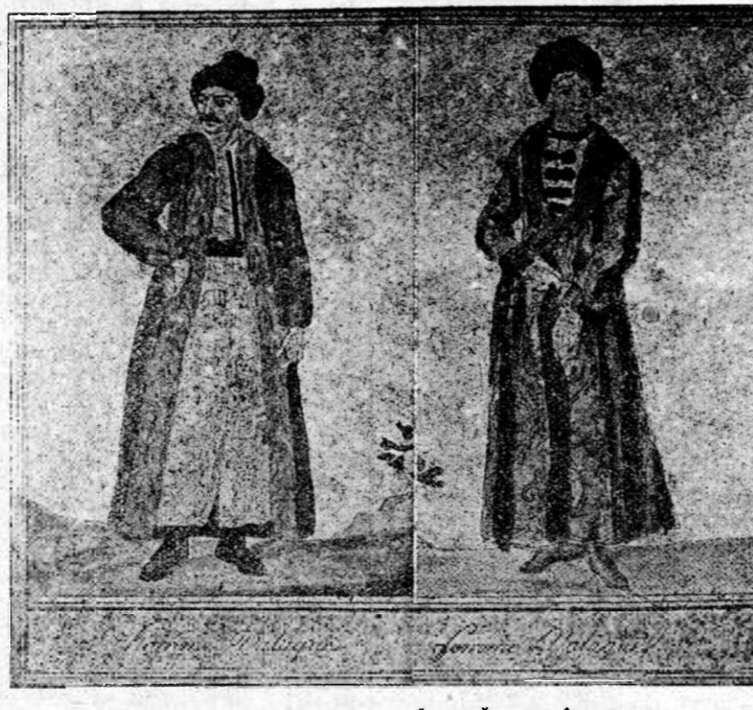
UN BOER CU SOTIA SA. CUM ERAU ÎMBRĂCAȚI ÎN COSTUME ROMĂNEȘTI CU 150 DE ANI ÎN URMA.