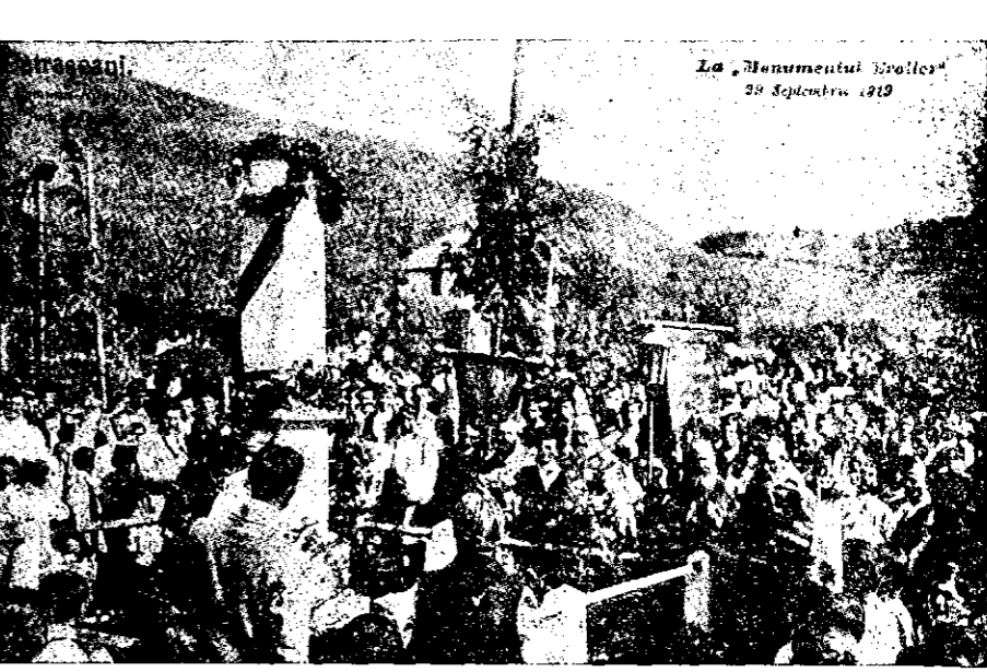
În satul Patrașcani, în preajma Bisericii monumentale zidită la anul 1920 de Ștefan Ruset, s'a ridicat un frumos monument pentru vitejii plecați de aci pe câmpul de luptă și care și-au dat viața pentru mântuirea țării și înțregirea neamului nostru românesc. — Inițiativa a luat-o Banca Populară „Runcul” din comuna Râpale (Bacău). Sfințirea acestui Monument care are săpat în piatră numele celor optzeci de eroi, s'a săvârșit la 19 Septembrie 1919.