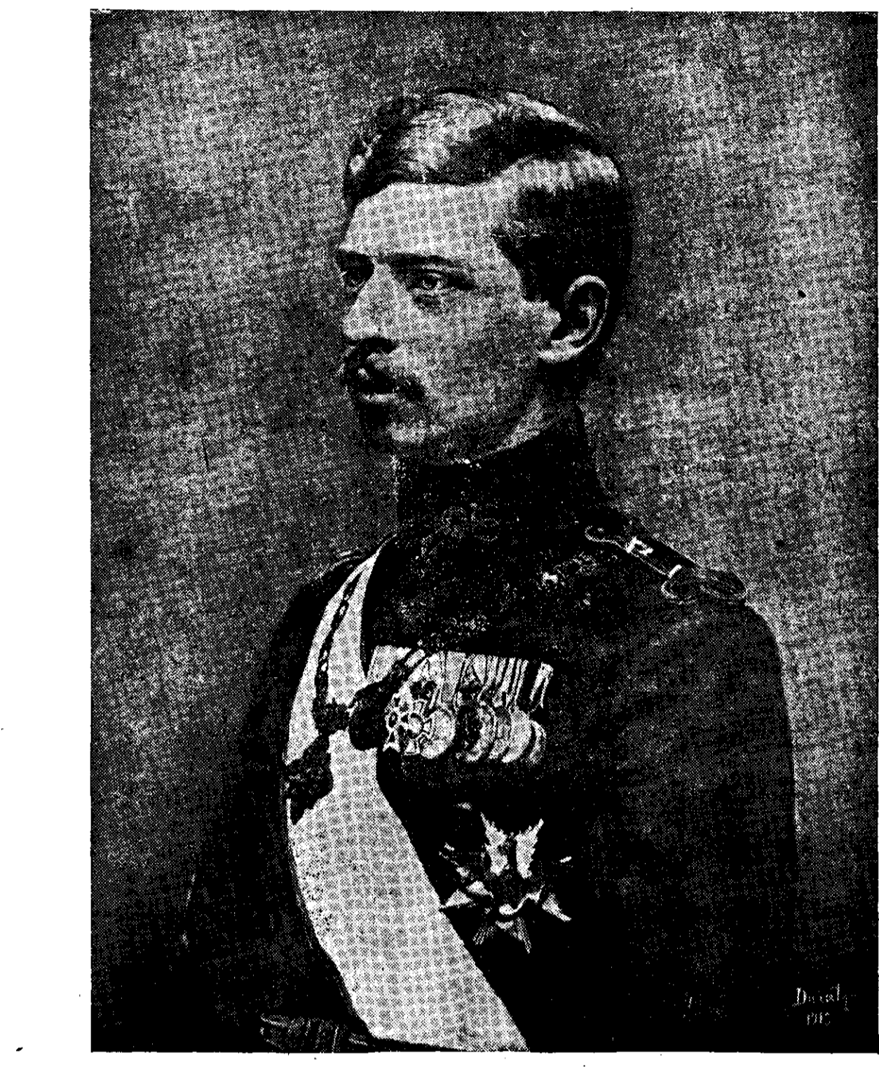
A. S. REGALĂ PRINCEPELE CAROL, MOȘTENITORUL TRONULUI

Cu prilejul împlinirii a 31 de ani... Moștenitorul Tronului, A. S. Regală Principele Carol, în ziua de 16 Octombrie a anului acesta, a împlinit treizeci și unu de ani.