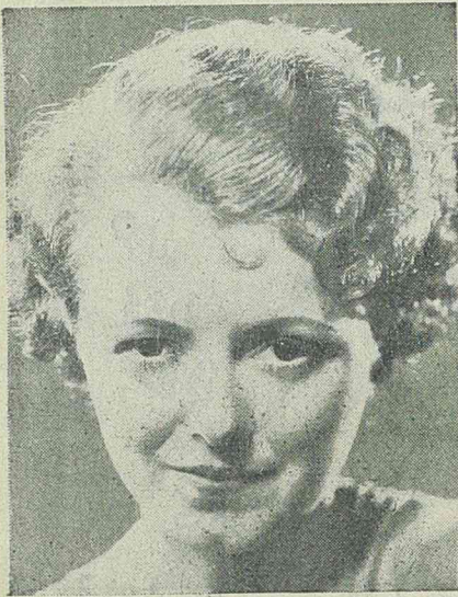
Janet Gaynor az amerikai kedven- verseny díjnyertese