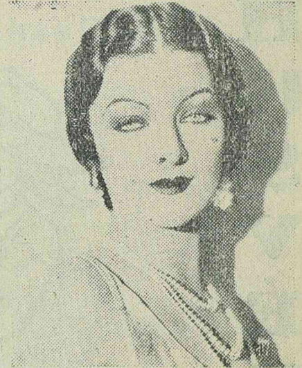
Myrna Loy a mozilátogató közönség kedvence

Kedd, szerda, csütörtök: Ők és Hamlet. Patt és Pattachon első beszélő filmje.