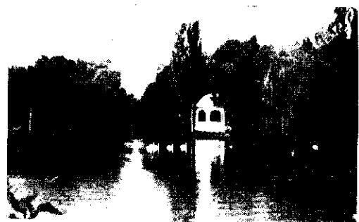
O. parcul! Lebedele, peisagiile cu plopi, sălcile plângătoare, pavilionul...

Mai e nevoie de completări? Nu cred. Tabloul e deplin, cu elemente spectaculare, specifice, așa cum ne-am deprins a-l cunoaște de mult. E un fond uman pentru lumea caragialească. Imi amintesc cât de spontan, o doamnă pe care o cunoscusem din întâmplare ex-