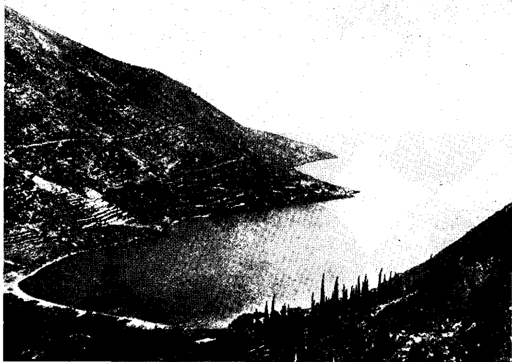
Itaca, insula lui Ulise

„Le chemin, comme une trace de coulouvre déroulait ses anneaux au milieu de l'oseraie. Il faisait chaud: dans l'air visqueux, des touffes de mouches dessinaient les molles ondulations de leur danse nuptiale. Ulysse aspirait goulument des flocons de vent tiède, espérant une vaine fraîcheur. On en-