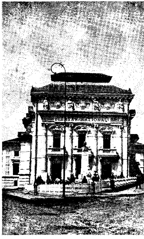
Lângă „Teatrul Național”, în stânga statuii lui H. G. Lecca...

Poate că una din puținele satisfacții ale călătoriei mele, a fost că am ajuns să pun la punct „chestia carului” (E vorba de „carul cu proști”). Trecând