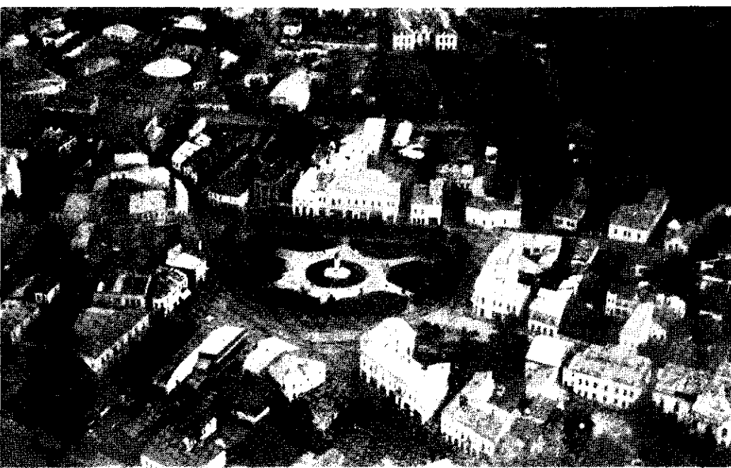
Caracaleni numesc acest centru „Cadrilater”...

Nu cred să știe toată lumea că Iancu Jianu e din Caracal. Dacă n'ar fi decât acest fapt și încă socotesc că ar trebui, în ansamblul orașelor românești, să se bucure de altă faimă Caracalul, decât ar da să se înțeleagă născocirea cu „carul”. Ca pe vremuri, într-o grădină, mai auzi pe țigani, introducându-te direct în materie: