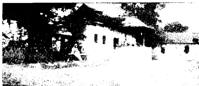
...Casă cu pridvor