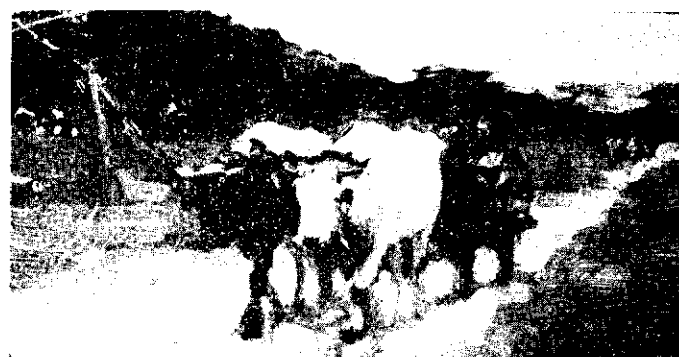
...Infoarcerea dela câmp