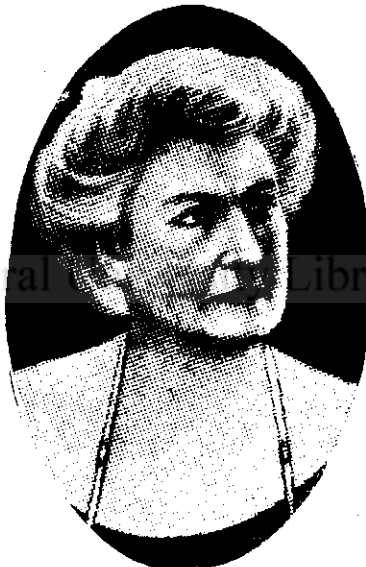
Principesa Luiza a Belgiei

Astfel stau lucrurile. Cât despre mine sunt perfect convins, acum când scriu rândurile de față, că misiunea mea nu constă în a apăra pe Alțeta Sa principesa de Saxa Cobourg-Gotha, nici să caut să micșorez greșeala ei ; dar ceea ce știu precis este că am datorita să smulg din ghiarele călăilor o femeie lipsită de apărare.