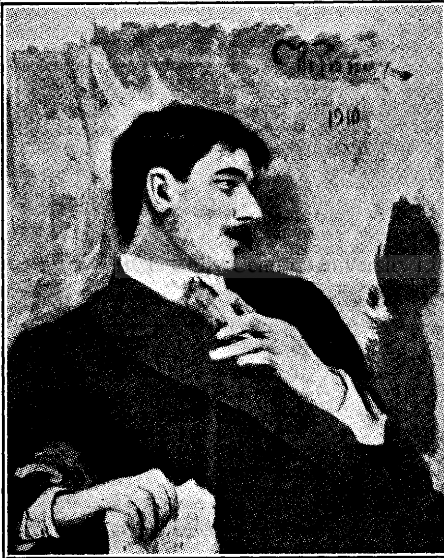
Portretul criticului rus Ciukovski de I. E. Riepin

Căci Riepin a adoptat libertatea, spațiul nesfârșit în care