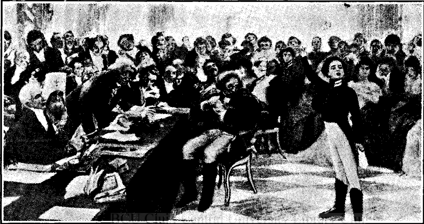
Tablou reprezentând pe poetul rus Pușkin la vârsta de 13 ani, de I. E. Riepin.

Și înoate în acest spațiu gheața, zdrobească-se valurile acestei mări înghețate de pi-