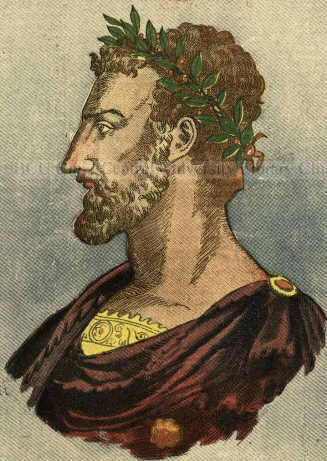
PIERRE DE RONSARD · 1524 - 1587

România a fost invitată de Franța la sărbătorirea a 400 ani de la nașterea celebrului poet, de origină română. — (Vezi explicația în text)