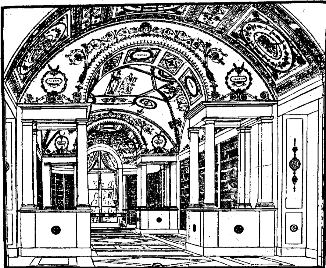
Biblioteca dela Malmaison