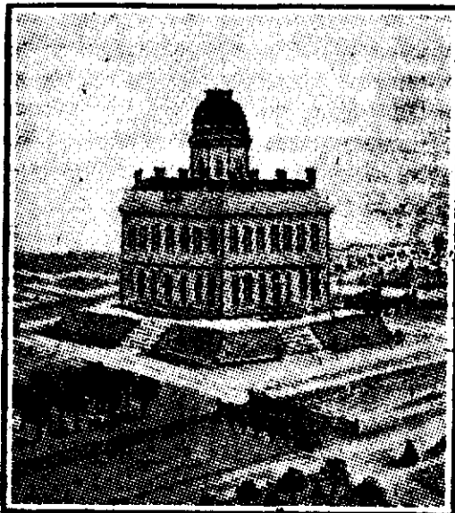
Castelul dela Navarre

„La vre-o două leghe de oras, Impăratul a asistat la un spectacol demn de dânsul. Pe coasta unui munte s'a organizat o mică serbare cămoenească și militară în cinstea Im-