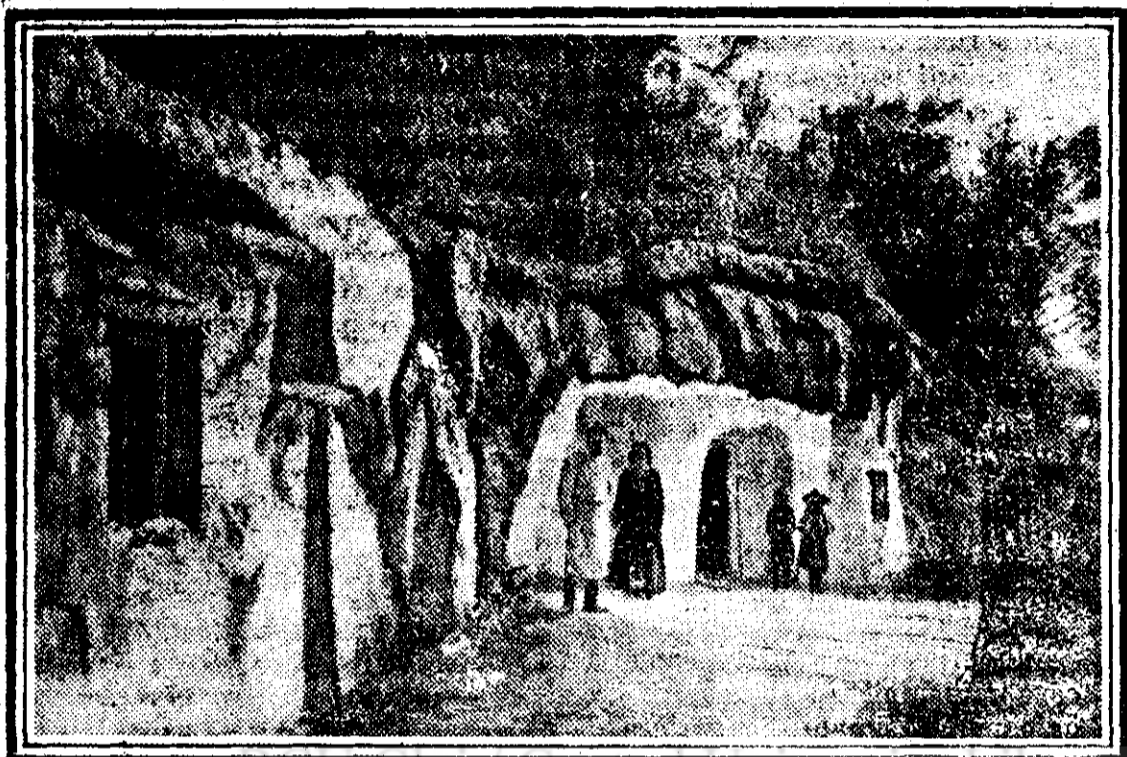
Peșterile din mănăstirea Jabka transformate în chilii pentru călugări

iar dealurile se perd în nesfârșit, îngrămădindu-se multime, acolo unde se găsesc, nevăzuți de aci, mureții Carpați.