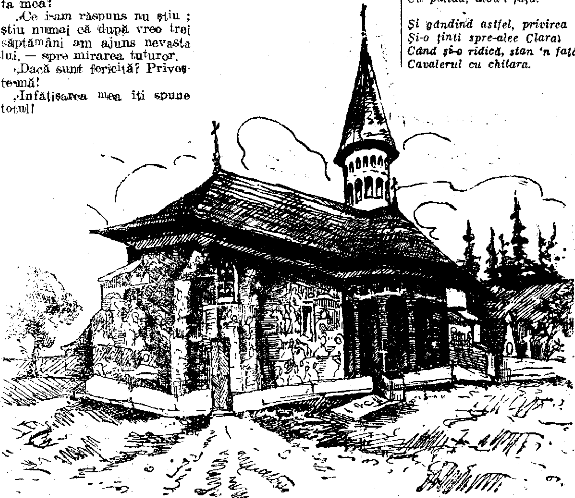
Biserica mănăstirii Voroneșul, zidită de Ștefan cel Mare în 1488 (Bucovina).

Și gândind astfel, privirea Și-o țintii spre-alee Clara! Când și-o ridică, stan 'n faţă-i Cavalerul cu chitara.