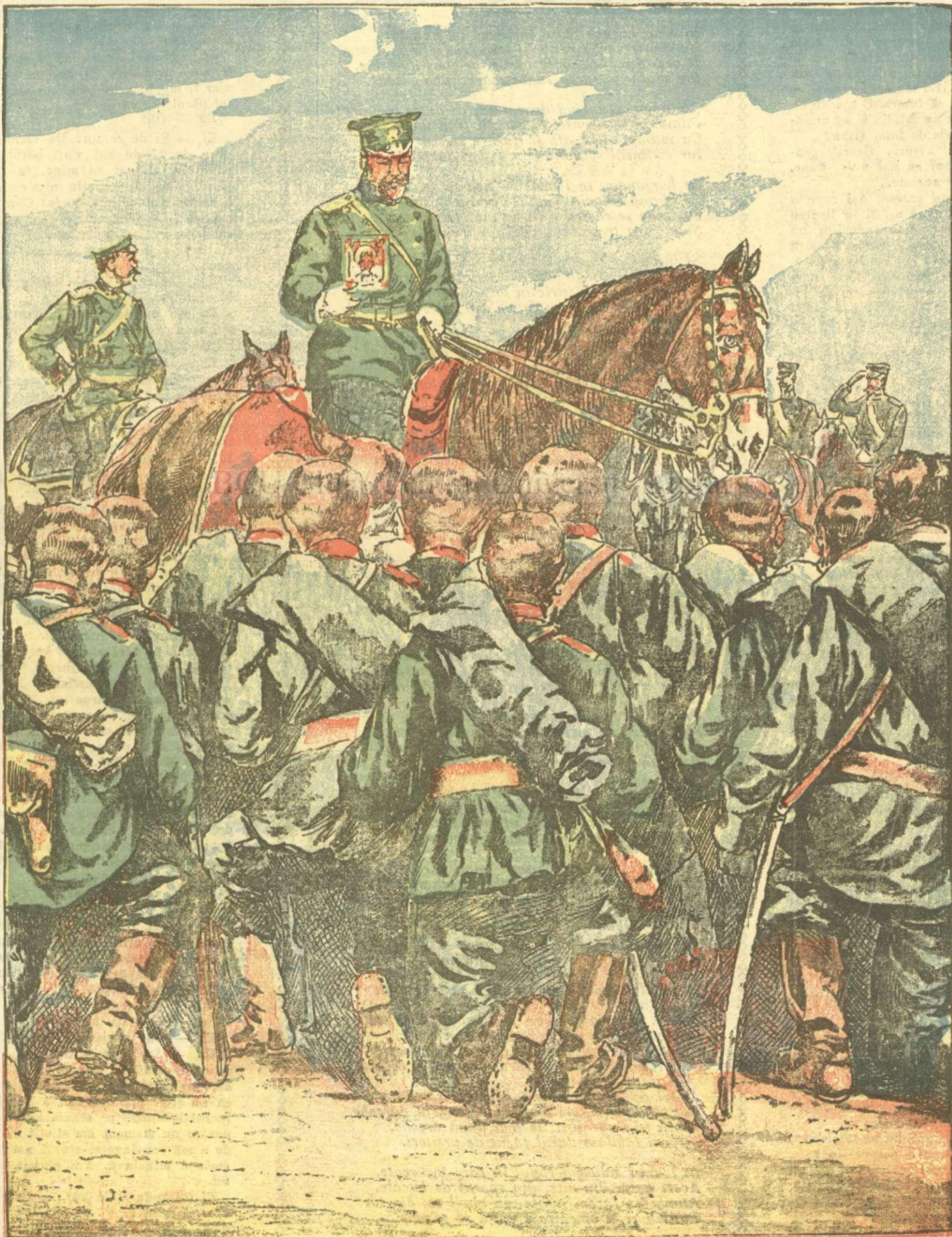
Țarul Rusiei trece pe dinaintea frontului c'o icoană 'n mână.