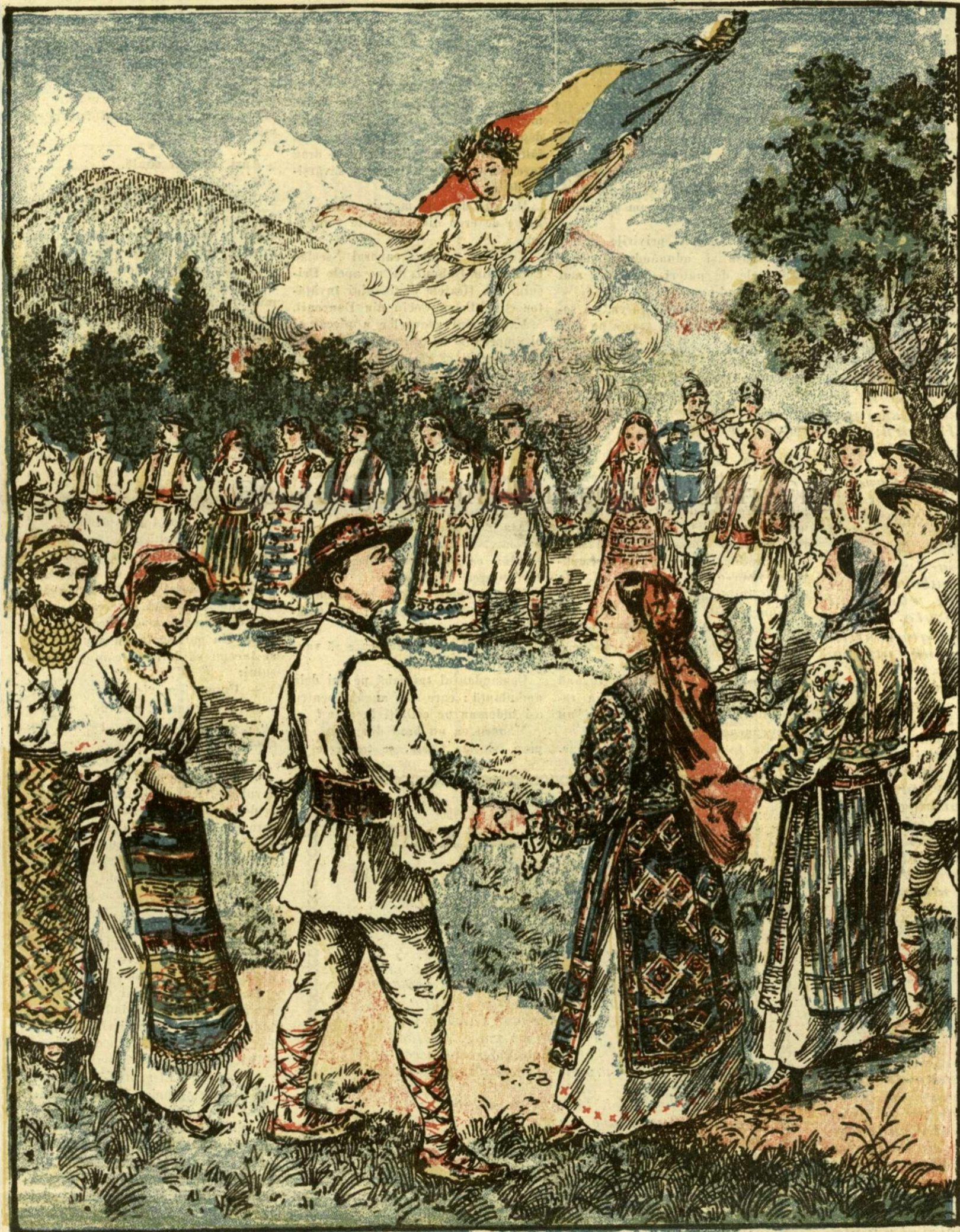
Marea Horă a Unirei