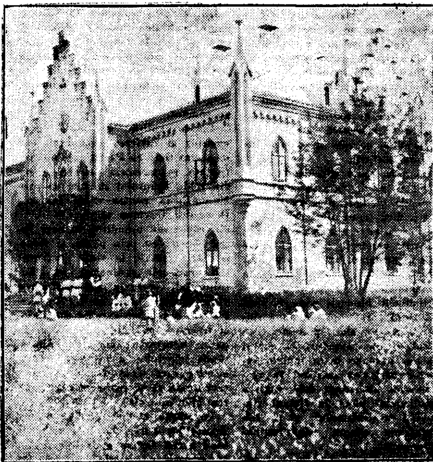
Palatul de la Ruginoasa a lui Alexandru Ioan I Cuza