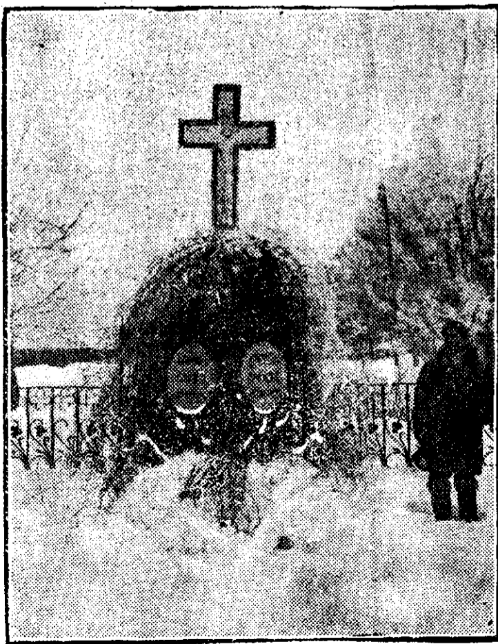
Mormîntul lui Cuza de la Ruginoasa