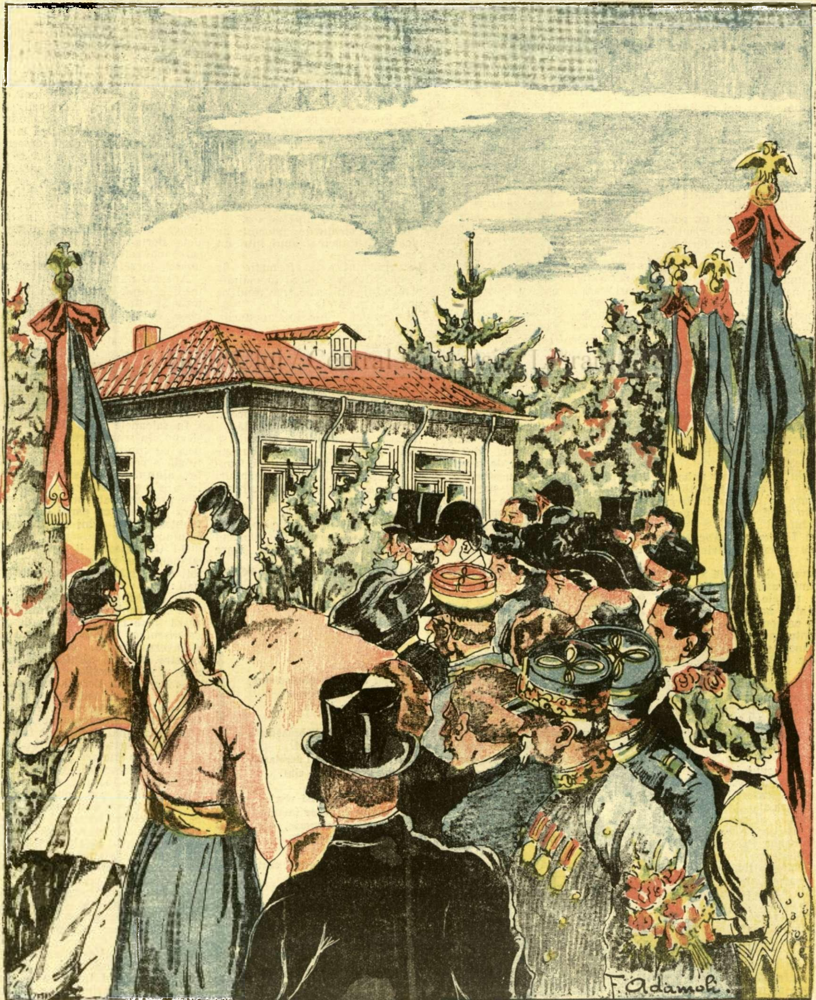
Comemorarea lui Vasile Alecsandri la Mircești