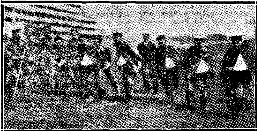
Convalescenții englezi au organizat o parodie a vestitelor alergări de cai numită «Derby din Epsom». Cel mai bine întremați au luat locul cailor și fug în locul lor, menținând astfel tradițiunea celebrului sport, spre bucuria asistenților care rād și aplaudă.

— Compania lirică dela Blănduzia a pus în repetiție opera co-