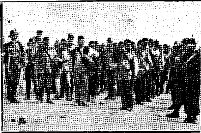
O coloană de prizonieri austriaci luată de italieni într'una din luptele din urmă.

La Brige. (turtit). — Dacă bănuiam că o palmă e atât de scumpă când o primești și atât de ieftină când o dai, știam eu ce-i de făcut!