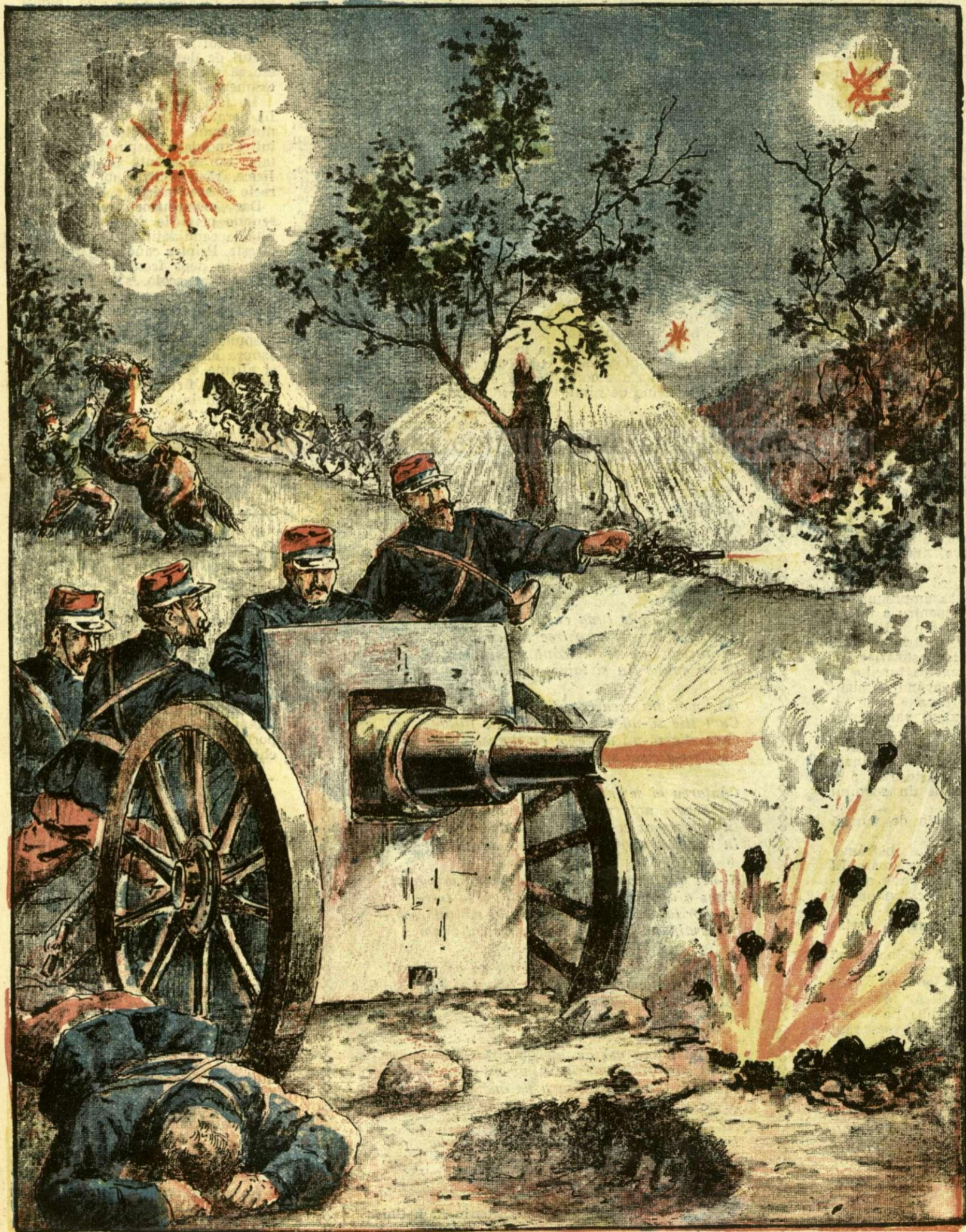
O baterie franceză într'o luptă de noapte

ANUNCIURI Linia pe pag. 7 și 8 - BANI 20 -