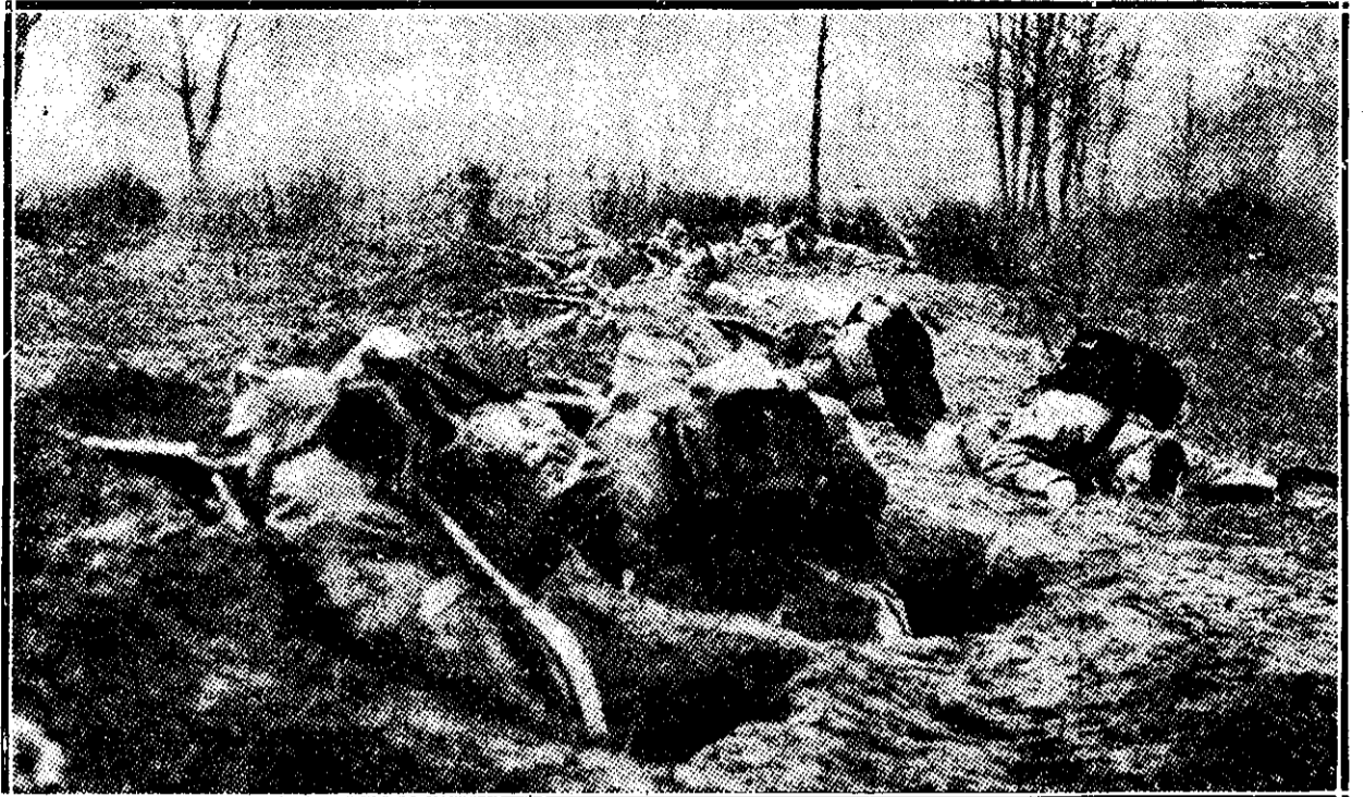
O luptă de tranșee

Neylies expune câteva peisaje insuflate de același sentiment al naturii și de același cald colorism cu care ne-am deprins să-l vedem