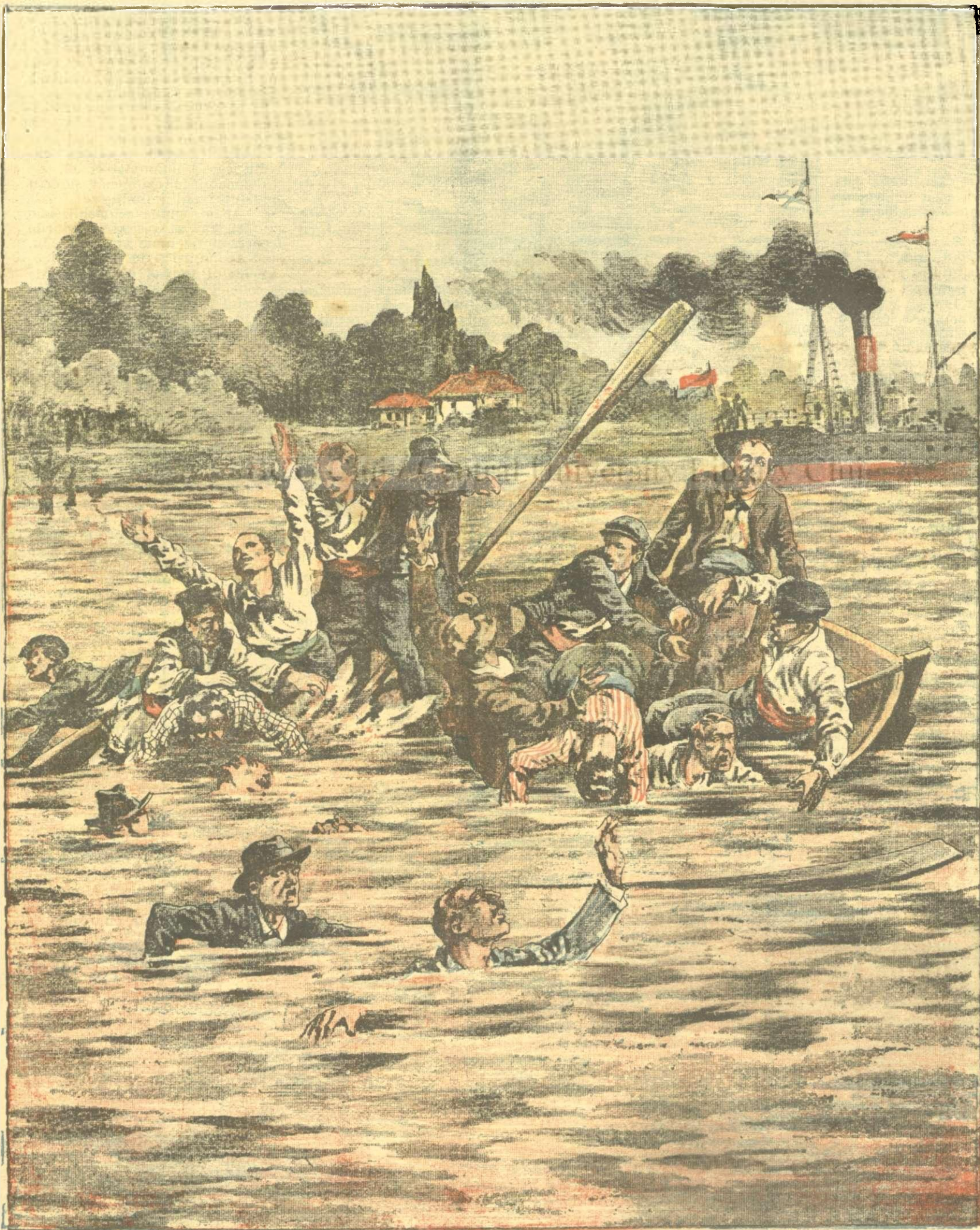
Groznică catastrofă de pe Dunăre, care a provocat moartea mai multor muncitori, în fața Brăilei