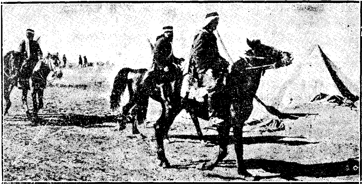
Beduinii în armata engleză.

Există și mistificări colective. Se anunța în mod public nașterea unui copil cu trei capete, al unui vițel oficial cu patru cozi prezentat școlii superioare de agricultură. Se spune că un spânzurat dus la morgă și-a venit în fire pe masa rece de marmură, auzind în mijlocul vizitatorilor râsetul soacii lui care îl recunoscuse. Știri importante sosese din toate părțile: nașterea unui curcan umplut cu sticlă la societatea științelor viitoare, apariția unui iceberg uriaș care a astupat gurile Dunării, sinuciderea unui avar care a voit să economisească astfel banii pe cari îi cheltuia cu mănărea, dispariția lui, capturarea a zece mii de aeroplane engleze de către un submarin german, furtul turn Eiffelului în timpul nopții de către un Zeppelin, întâia victorie austriacă, scufundarea provizorie a Constantinopolului în marea de Marmara spre a fi la adăpost de orice atac, etc., etc. Toate sunt opera unor păcăleli istețe, cea ce