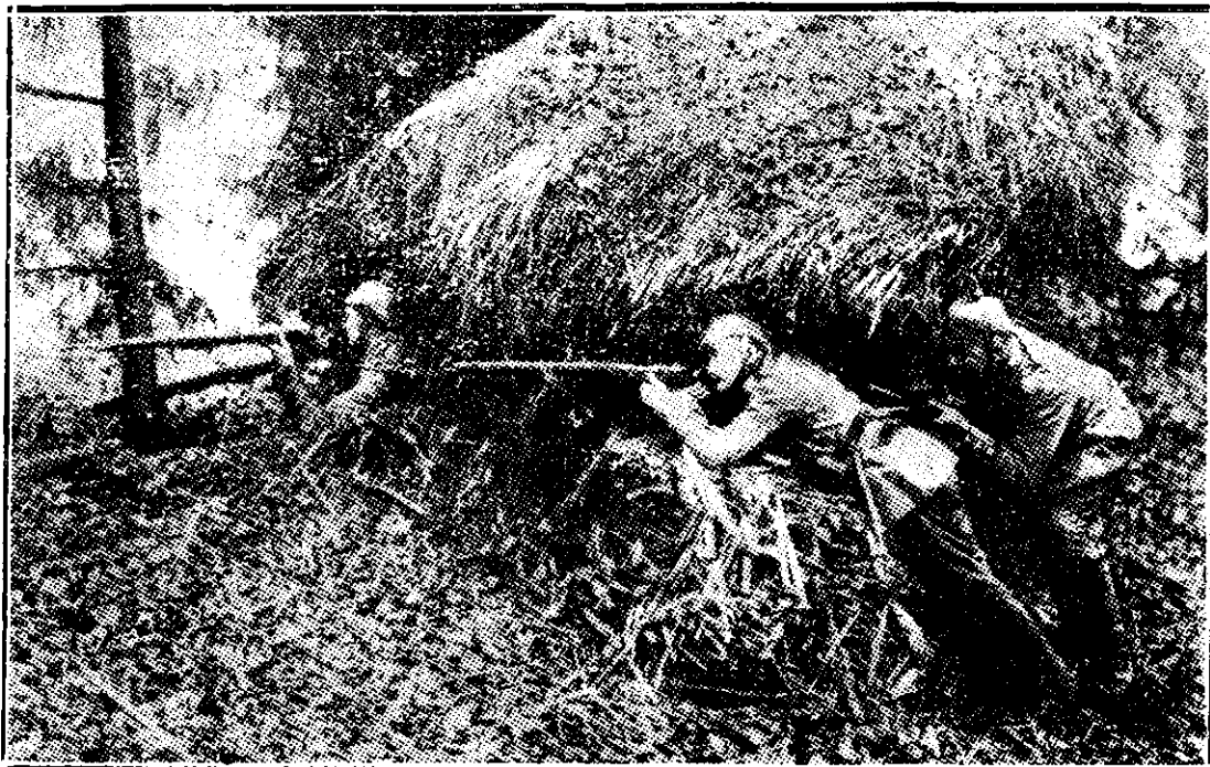
Trăgători germani de elită, într'o poziție culminantă.