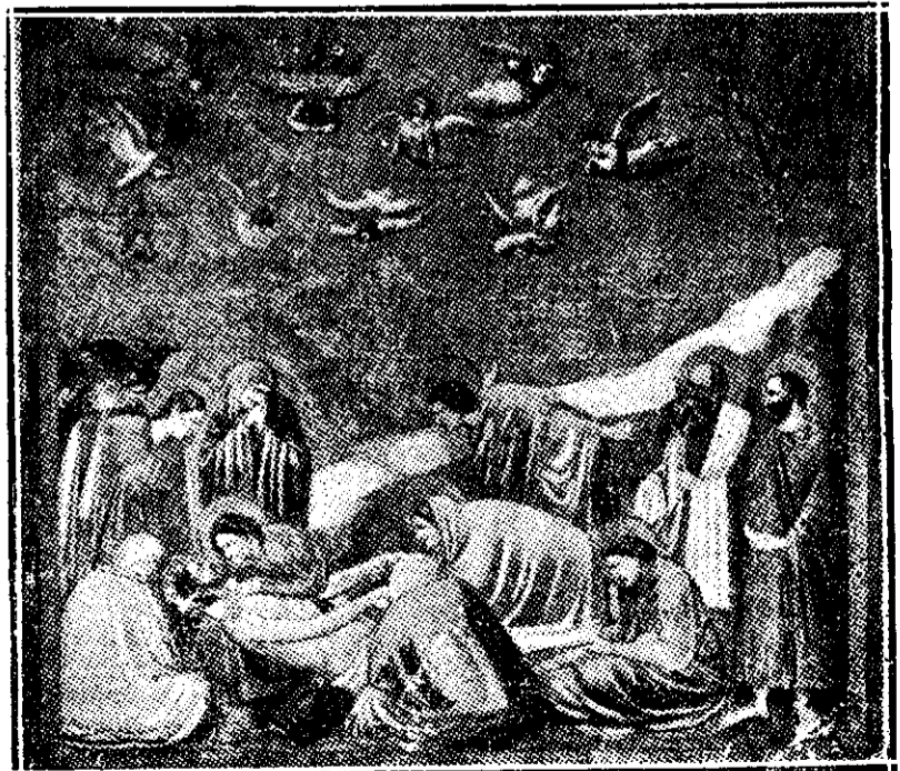
Patimile Mântuitorului, după un tablou de Giotto