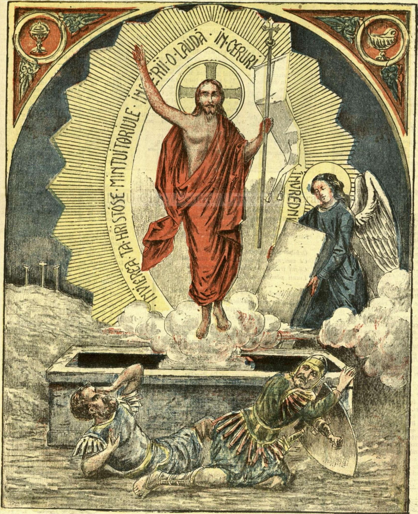
Christos a înviat!

ANUNCIURI Linia pe pagina 7 și 8 - BANI 20 -