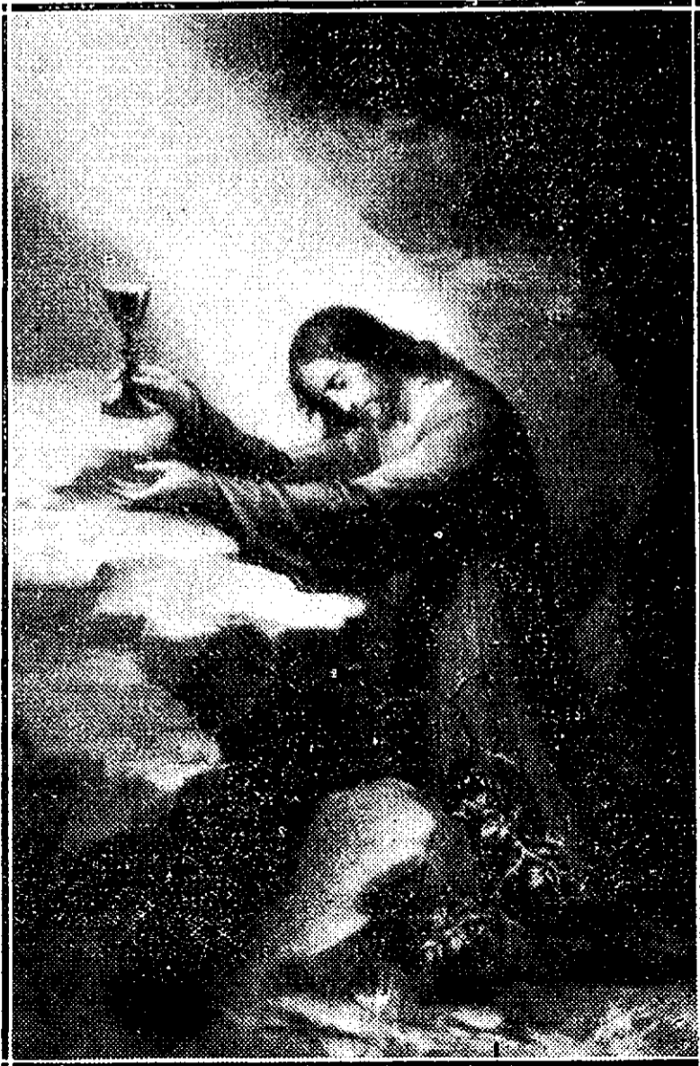
Isus în grădina Ghetsemani