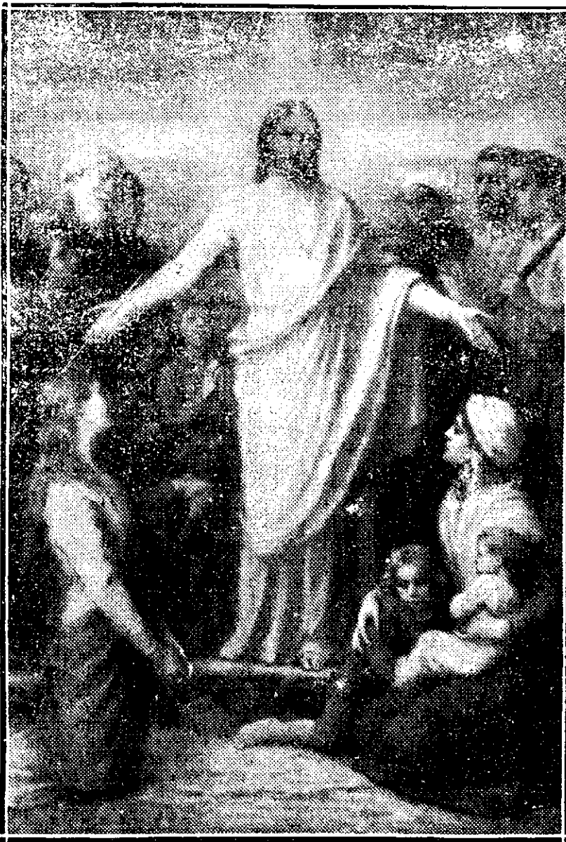
Lăsați copiii să vină la mine.

Înainte, când nu era tramvai electric, cei mai cu dare de mână huan trăsuri; cei mai mulți însă, anostolește. Când li vezi coborând pe strada Palat la vale, pe la Păștele de Aur , îi face impresia unui nesfârșit convoi de emigranți. Domni bătrâni și tineri, cu-coane, copii, servitoare, toți încărcati cu pachete cu de-ale gurii, cu fețele înveselite de-o mulțumire cum numai în țările moldovenilor înțelege în asemenea sărbători. Poate să fie frig, poate să geamă vântul, poate să te clou-rască colbul, nimic nu-i împiedică în drum. Un popor întreg, ca la un farmaroc, ce n'aintează spre Podul-Roș , se mărește cu cei ce vin din spre Socola și toți, grămadă, înegresc strada Nicolina . Dela haricică până la Perjoaia