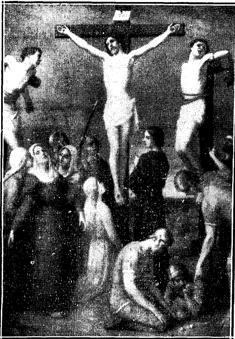
Răstignirea lui Isus Christos

Ion și Todită se culcară, așteptând să se ivească zorile, să vie tatăl lor de la înviere, să poată ciocni ouă roșii și să se joace cu oița pe tapșan și cu copii. Catrina, în vremea asta frîpse în