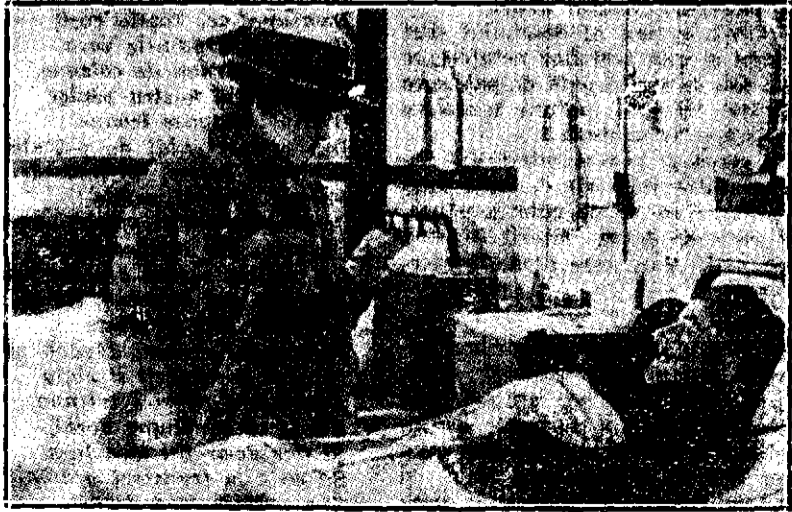
Adelina Patti la căpătâiul răniților. Celebra cântăreață se produce în toate săptămânile la Londra în profitul răniților belgieni.