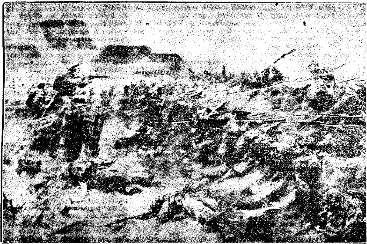
BATALIA DE LA YPRES

2) A pune capul în limbajul marinară însemnează a căuta vaporul într-o direcție voită.