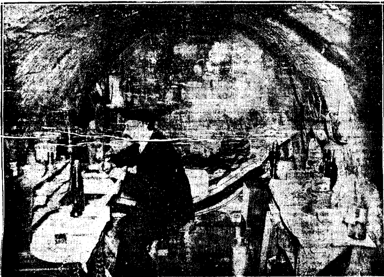
Judecătorul de pace din Soissons care și-a mutat cabinetul de lucru și camera de dormit în pivniță, din cauza bombardării orașului.