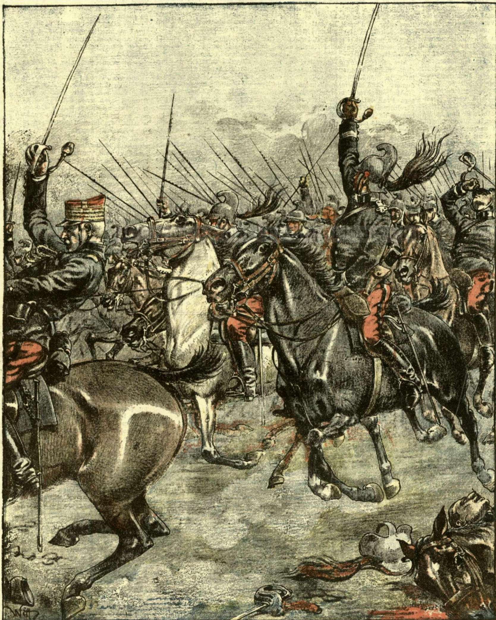
O sarjă a dragonilor francezi in care și-a pierdut viața generalul Eydoux, strigând: „Trăiască Franța