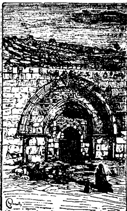
Intrarea Bisericii Maicei Domnului

Murind Maica Domnului, apostolii pe când transportau corpul spre mormânt, au fost atacați de un grup de evrei cari purtau încă în inimile lor vechi lor ură contra lui Isus.