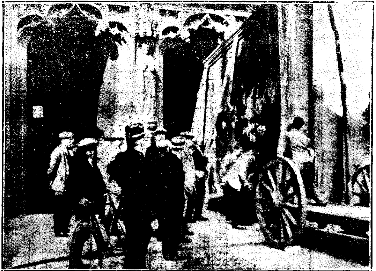
Transportarea la loc sigur a unei pânze de Rubens din Catedrala orașului Anvers.

Izbândă-i răsplata celor ce și-au jertfit viața, dar oricare i-ar fi și durerile, izbândă să binecuvinteze pe soldații Franței.