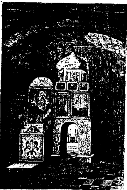
Mormântul Sfintei Fecioare

De aceea, mormântul acesta ascuns în stâncă bisericii subterane, înconjurat de tăcerea bolților întunecoase și de adorațiunea sinceră a pelerinilor, îți umple sufletul de o nespusă duioșie.