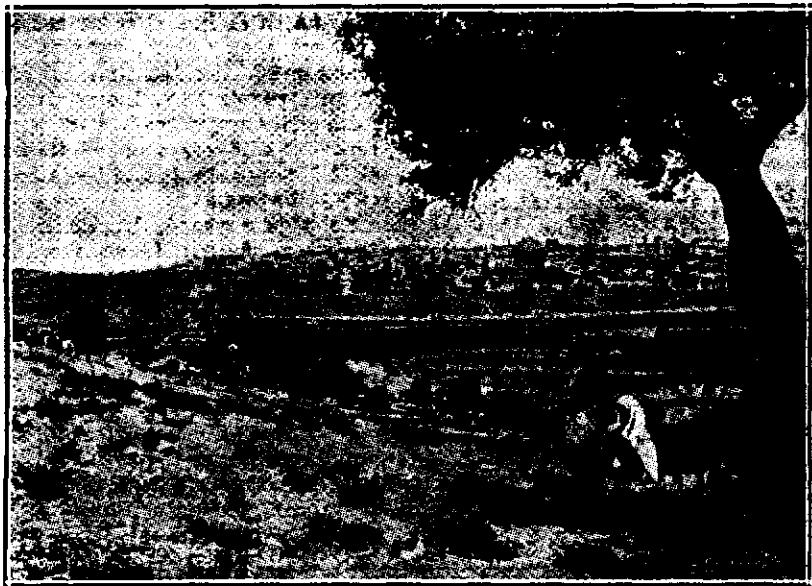
Ierusalimul văzut de pe muntele Măslinilor

Pe coasta Muntelui măslinilor, într-o vale, se ascunde mica grădină Getsemani, martora suferințelor lui Isus.