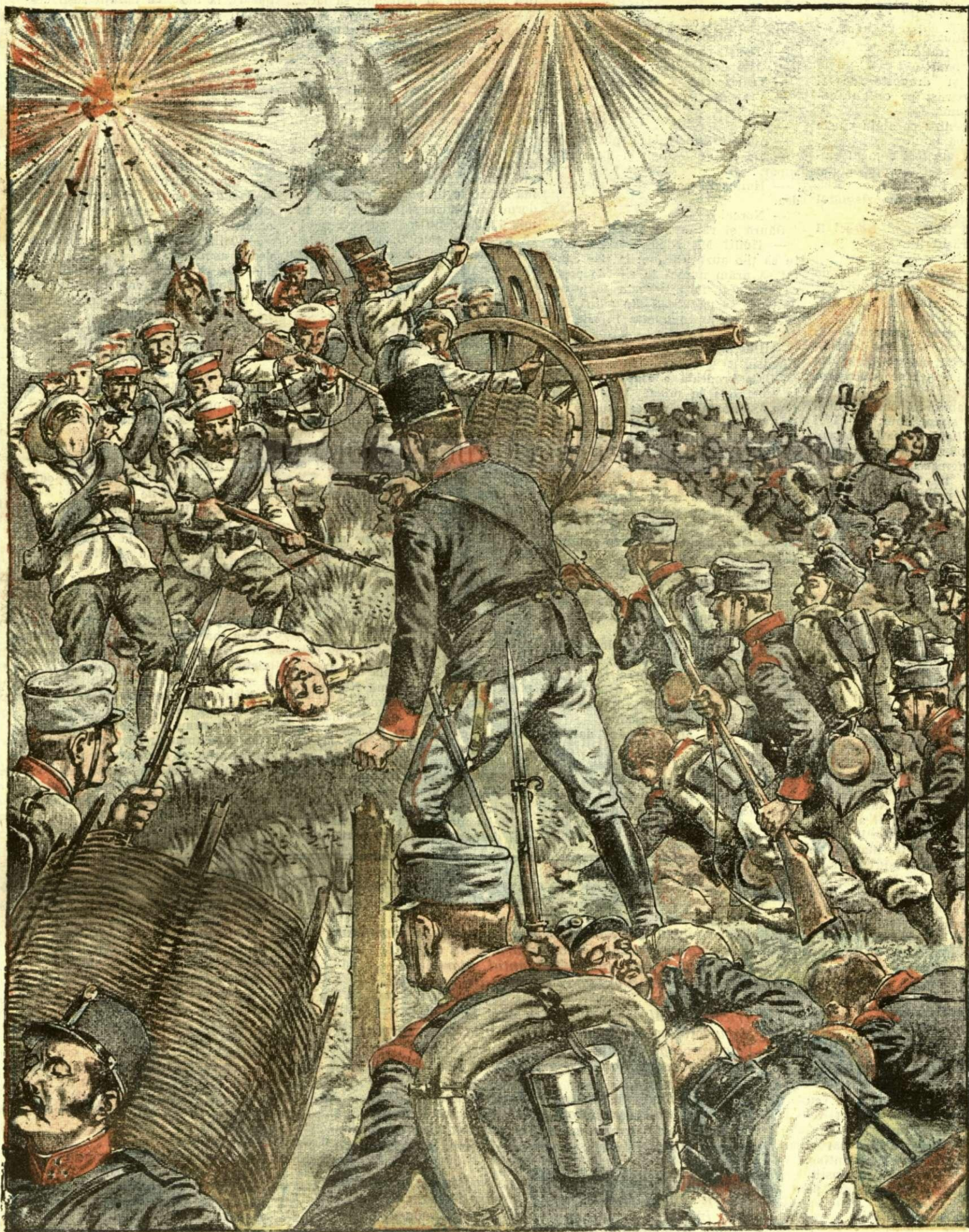
Bătălia de la Lemberg, unde austriacii au fost înfrânți

ANUNCIURI Linia pe pagina 7 și 8 - BANI 20 -