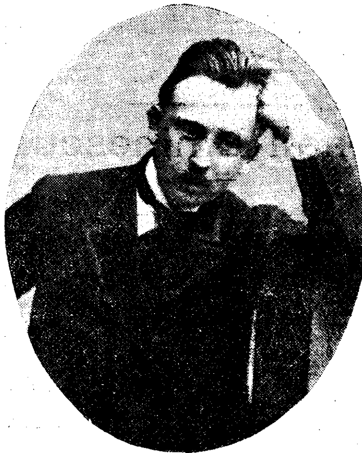
D. OCTAVIAN GOGA

În mijlocul perspectivei splendide ce ne deschid descrierile sale, parcă nu-și are loc durerea lui, parcă simțim ceva forțat în tot ce spune, ceva supărător și obsesiv. Adevărul e că nu putem să admirăm și să fim curioși sufleteste de cât de învingători. Filozofia resignării, a iubirii și a milei își are explicația profund omenescă în viața noastră, dar e o lege mai tare ce plutește deasupra tuturor concepțiilor și a sentimentelor noastre: dorința de a trăi și manifestarea prin voință a acestei dorințe. Poeții epici rămân cei mai mari și cei mai admirați, pentru că au revărsat în versurile lor energia, puterea de expansiune a indivizilor dintr-o societate anumită. În ochii urmașilor noștri, în cumpăna judecării lor drepte, va cântări mult această lipsă de energie, această re-