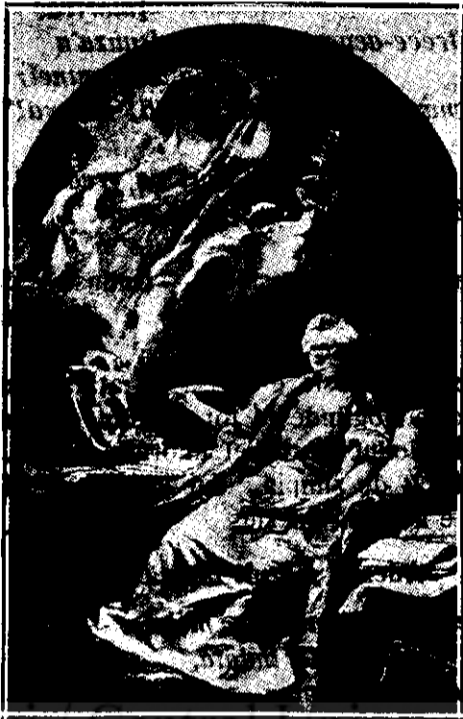
Apoteoza Carmen Sylvei

A fi tare, — înseamnă a împlini cu credință și cu stăruință lucrarea începută, chiar și atunci când împlinirea datoriei noastre nu ne învesește, când nimeni nu ne dă mână de ajutor, când nu suntem îmbărbătați ori mângâiați prin laude.