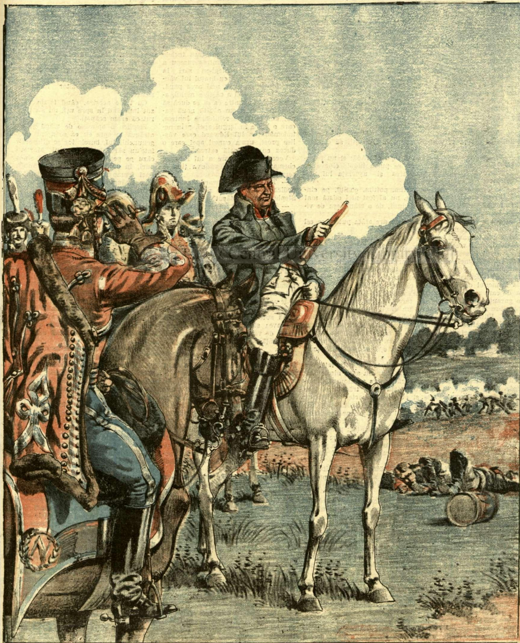
NAPOLÉON IN LUPTA DE LA LIPSCA

ANUNCIURI Linia pe pagina 7 și 8 — BANI 20 —