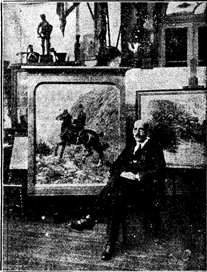
Suveranul în fața unui portret al său, executat de pictorul George Scott.