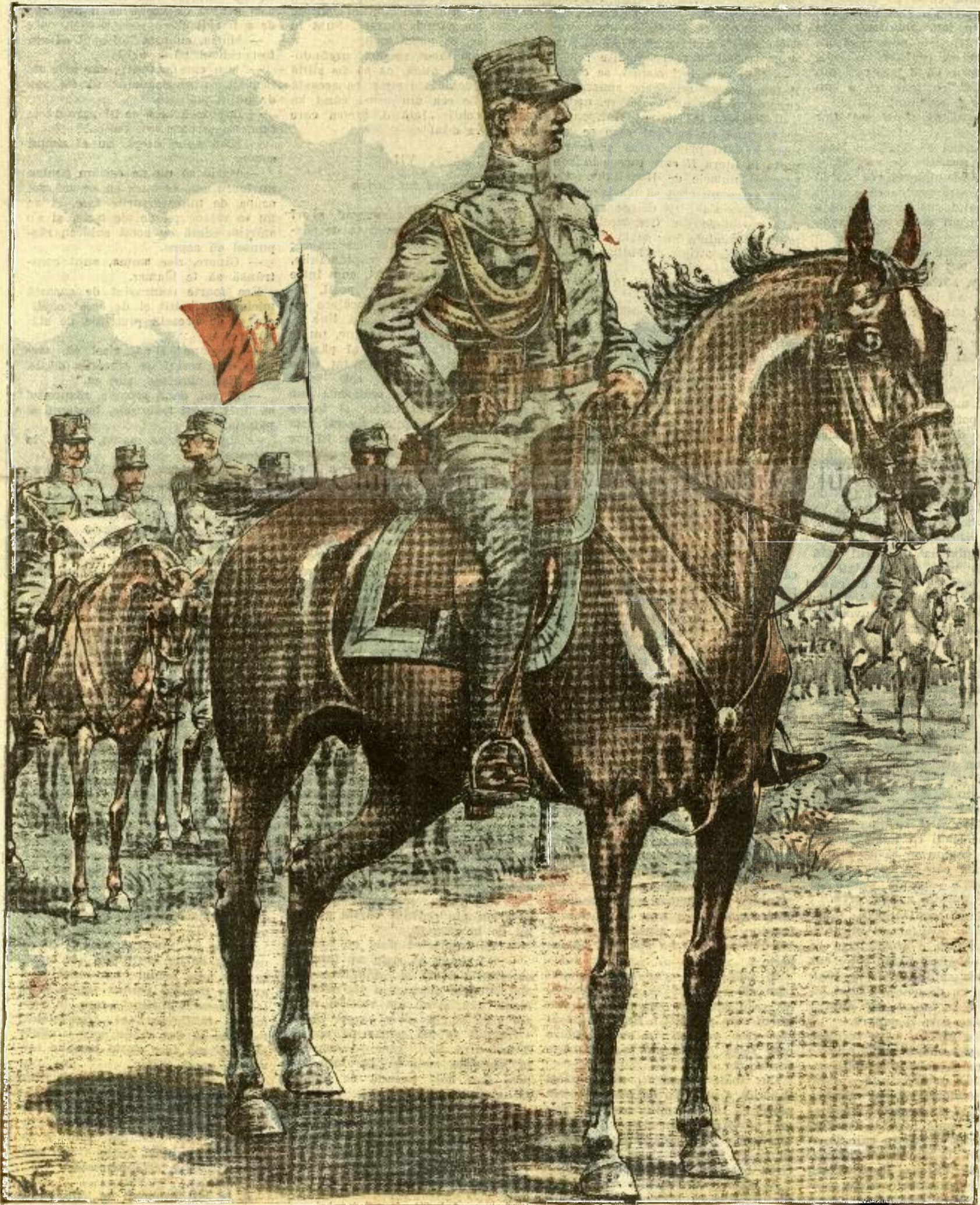
PRINCIPELE CAROL PE CAMPUL DE OPERAȚIUNI

ANUNCIURI Linia pe pagina 7 și 8 — BANI 20 —