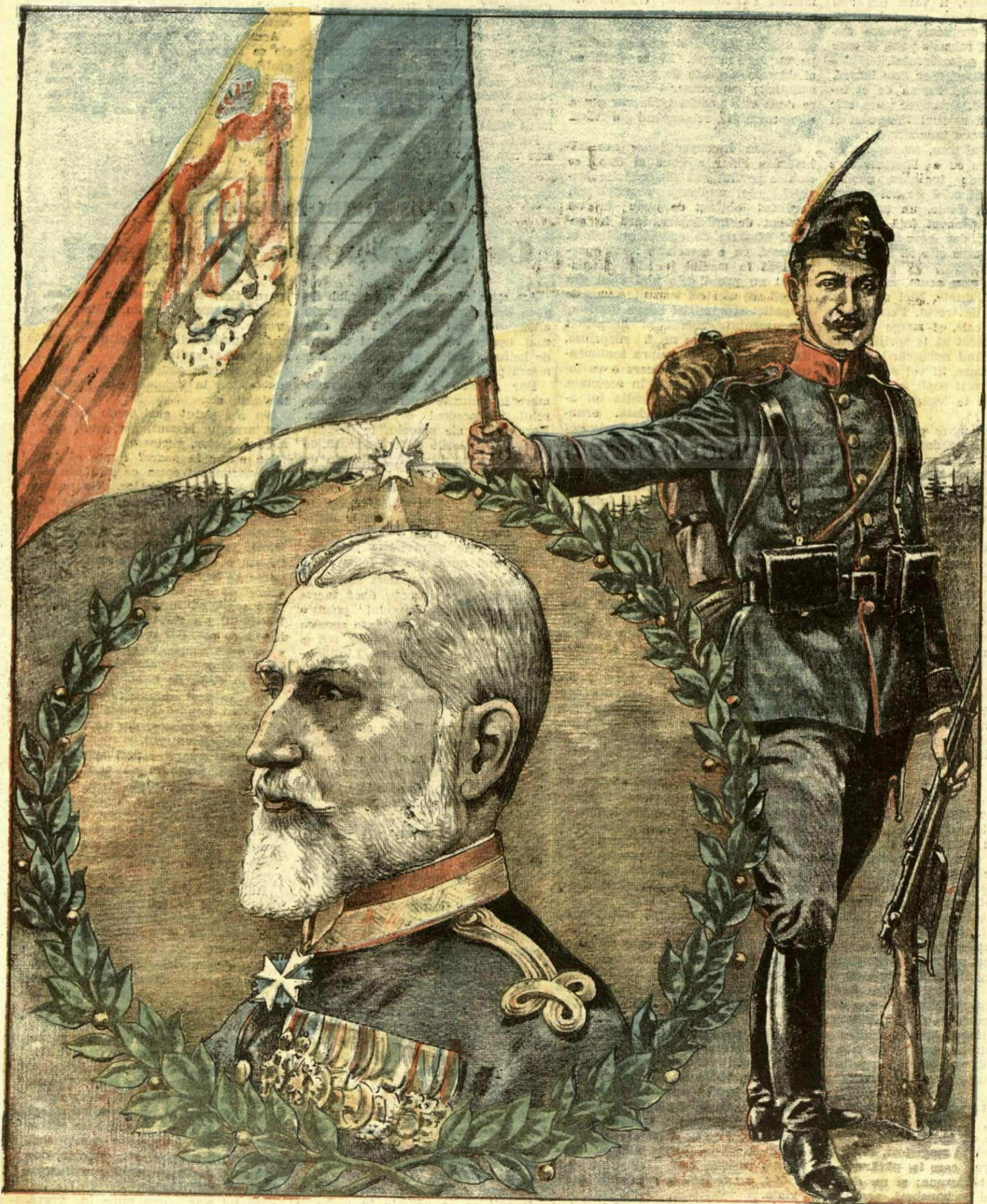
Ţăuritorli Făcei. — Regele și Dorobanțul.