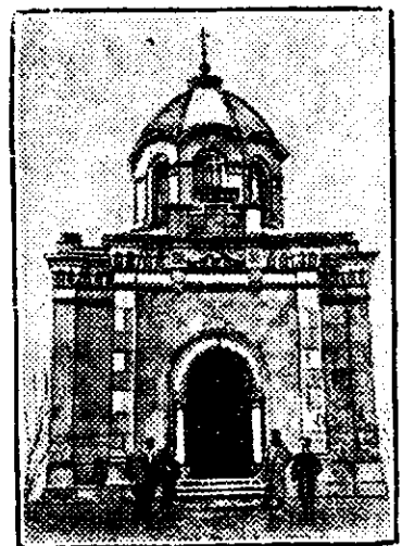
Capela română din satul Grivița, care a fost vizitată deunăzi de Suveranul nostru