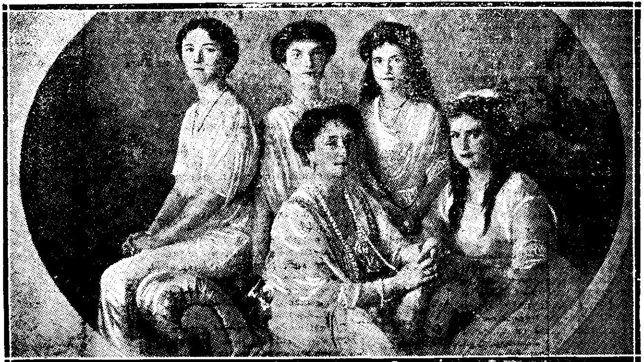
Țarina Alexandra a Rusiei, înconjurată de cele 4 fiice ale sale: Olga, Tatiana, Anastasia și Maria

Și învâlvind icoana cu acoperământul dela o masă, adăose :