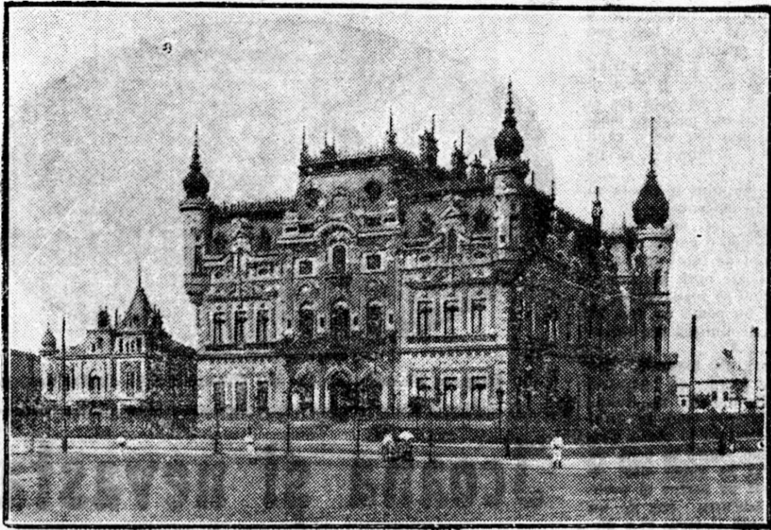
al Ministerului de Externe unde s'a încheiat pacea balcanică