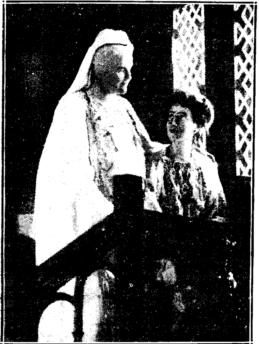
M. S. Regina Elisabeta și A. S. R. Principesa Maria (După o fotografie-recentă)