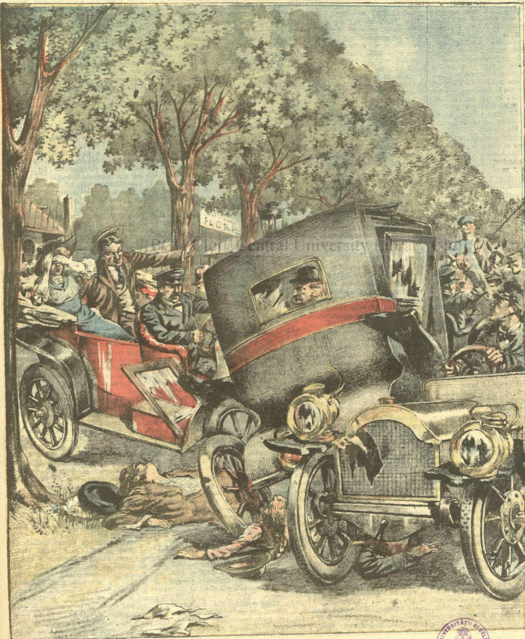
GROAZNICUL ACCIDENT DE AUTOMOBIL DE LA ȘOSEA