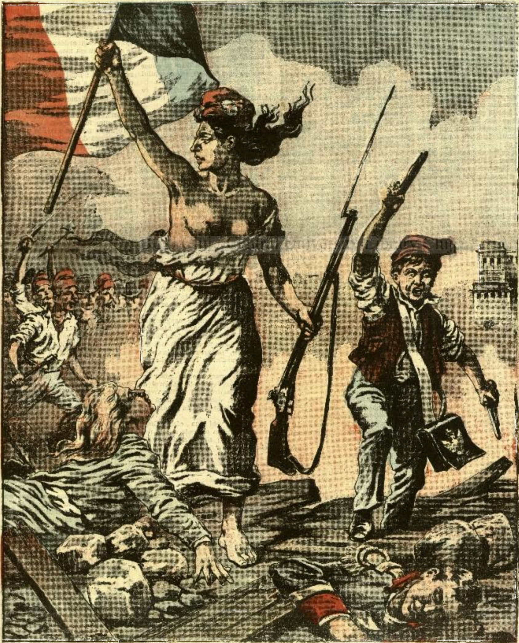
PE BARICADĂ. — Scenă din celebrul roman „Mizerabilii”, a lui Victor Hugo.

ANUNCIURI Linia pe pagina 7 și 8 —BANI 20—