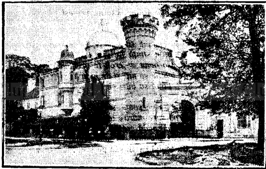
Observatorul de la Iași, al lui Placemariou

Copernic a pus însă regulă, a oprit Soarele din cursa lui nebună și dând un bobârnac grăunțelii de nisip, l-a pus să alerge în jurul soarelui cu