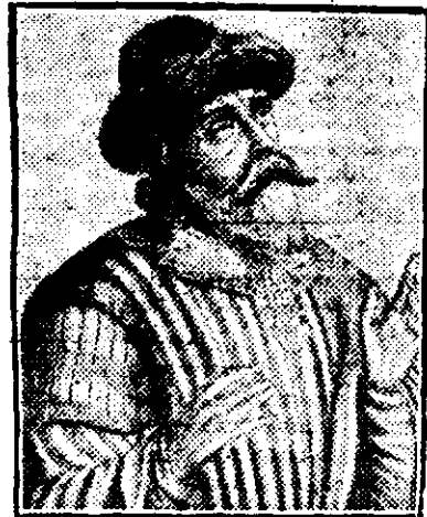
Constantin XI Paleologu, ultimul împărat grec al Constantinopolului (1453).

Câteva ore mai târziu, secura deschise porțile Sfintei-Sofia; bătrâni, femei, fete, călugări, credincioși, umpleau această vastă biserică, a cărei tindă, capela, galerie, subsol, tribune imense, domuri și platforme, ar putea să cuprindă populația unui oraș întreg. Un ultim strigăt se ridică către cer, ca o singură voce a creștinismului în agonia; în câteva clipe numai, 60.000 de bătrâni, femei și copii, fără deosebire de rang, de vârstă ori de sex, fură legați cot la cot, bărbații cu frânghii, femeile cu tulpanele sau centurile lor. Acest mănunchiu