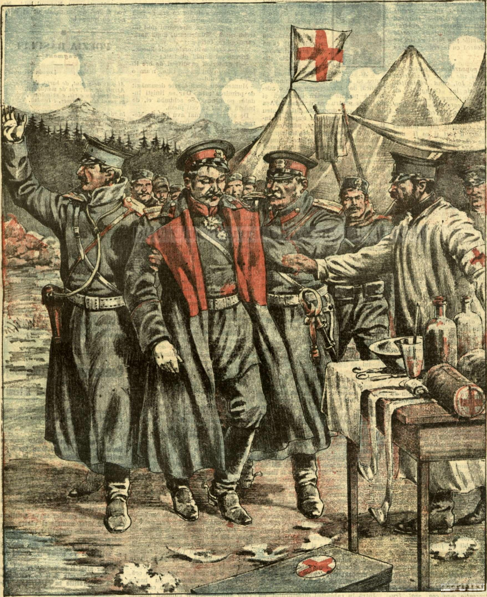
Principele moștenitor al Muntenegrului, rănit pe câmpul de război.