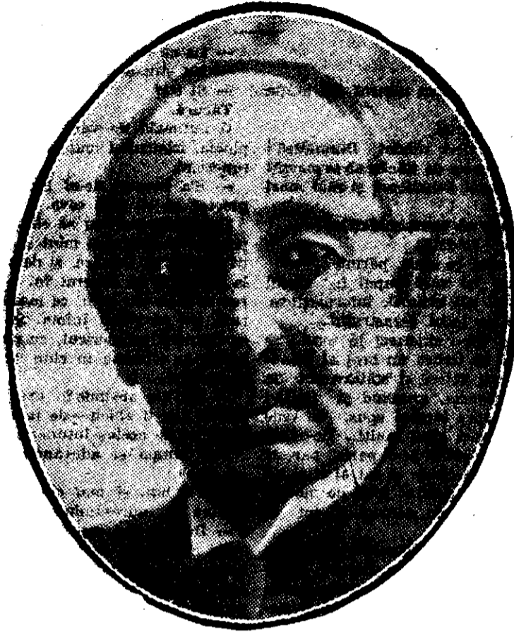
Marele artist în onoarea căruia s'a dat Joul seara un mare festival la teatrul național din Craiova.