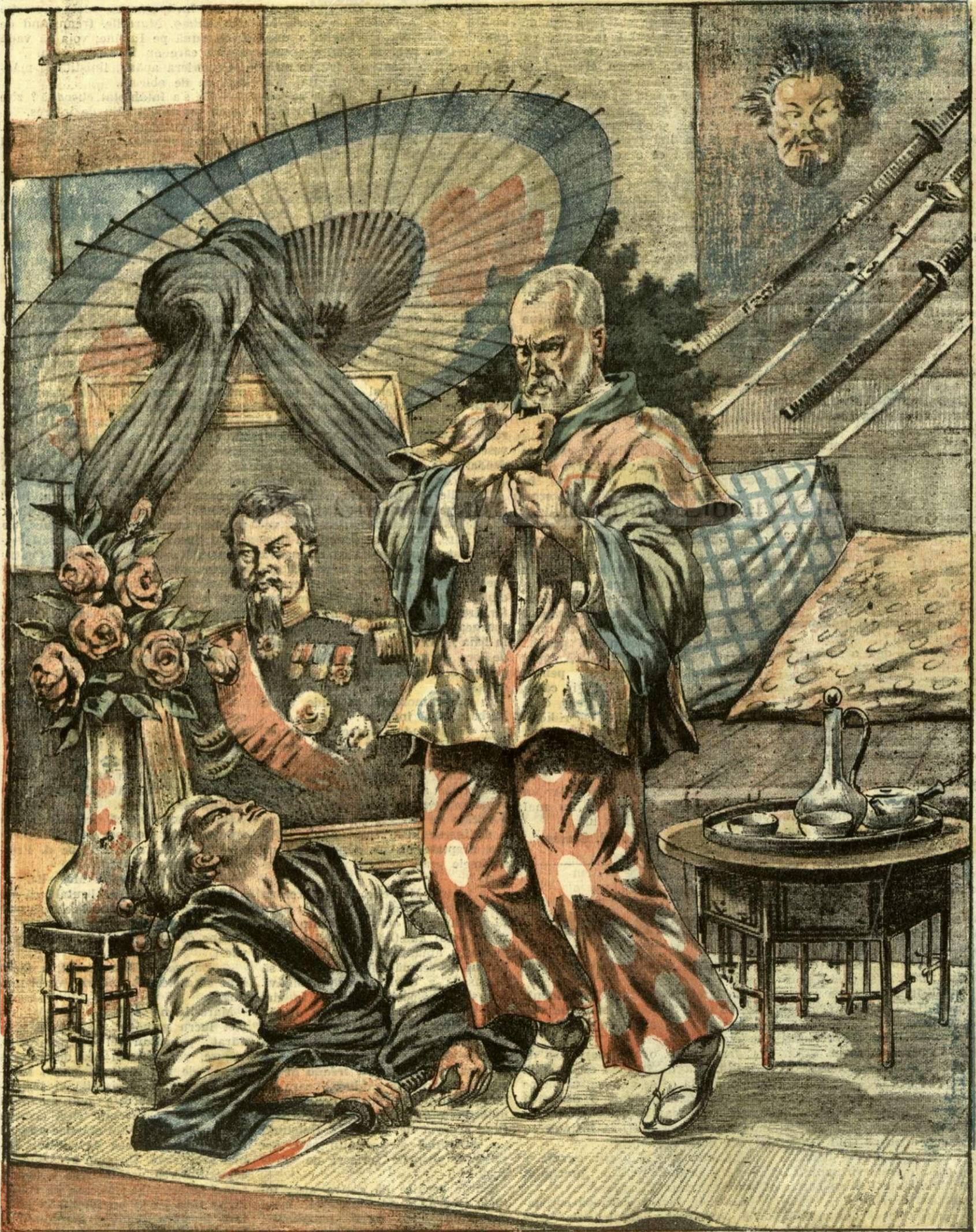
SINUCIDERA MAREȘALULUI JAPONEZ NOGI ȘI A SOTIEI SALE. — (Vezi explicația).

ANUNȚURI: — Linia pe pagina 7 și 8 bani 20 —