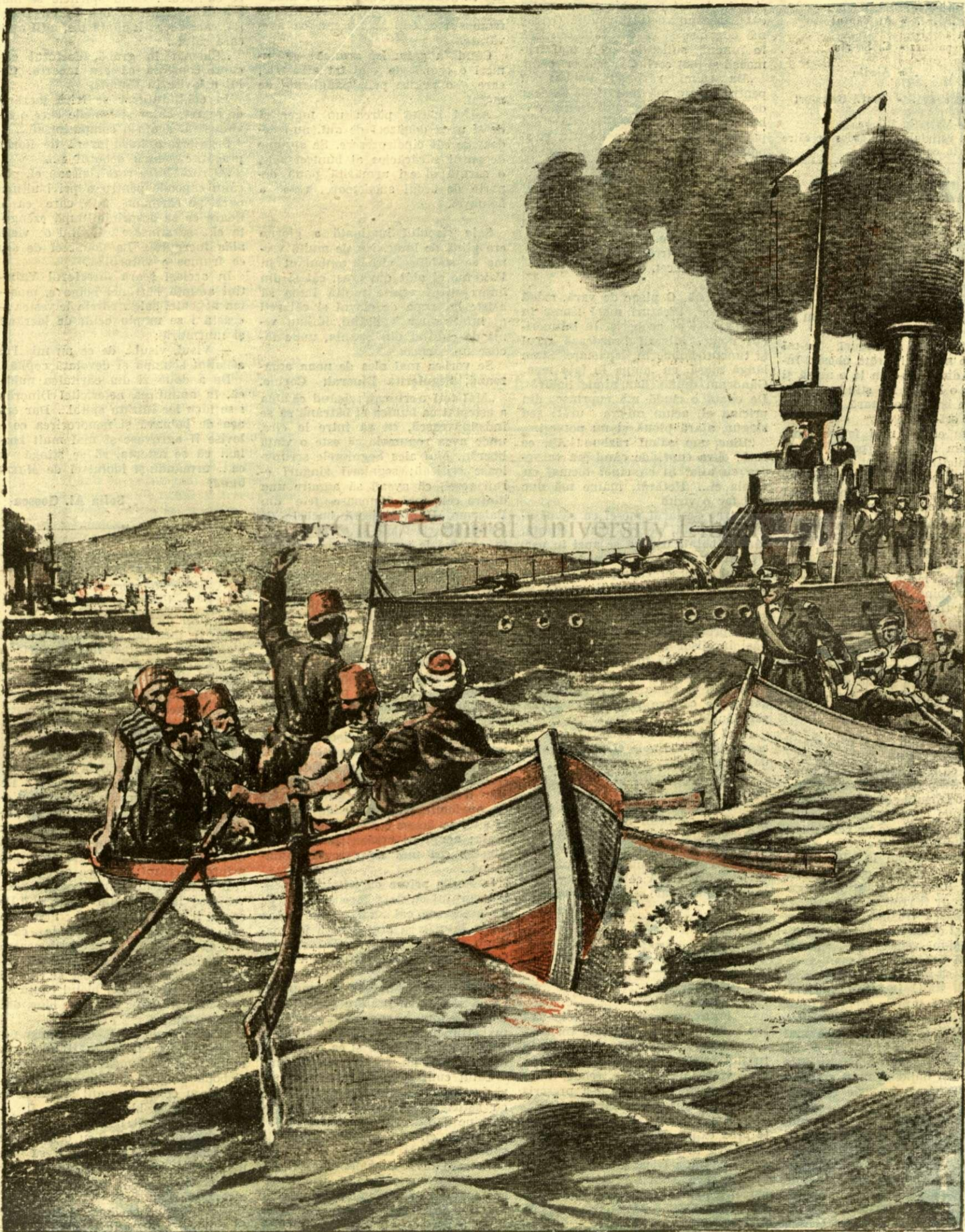
PRINDEREA VALIULUI DIN RHODOS DE CATRE ITALIENI. — (Vezi explicația).

ANUNȚURI: — Linia pe pagina 7 și 8 bani 20 —