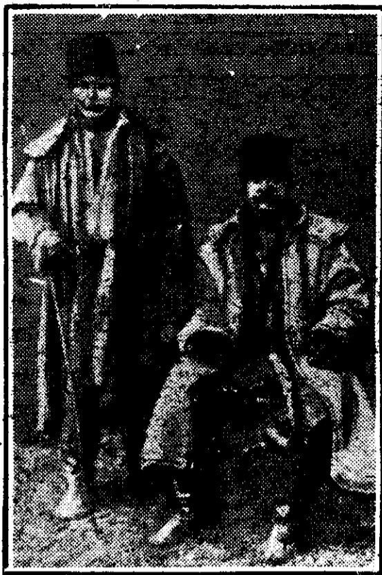
Tânăr român basarabean din timpul Hotinului