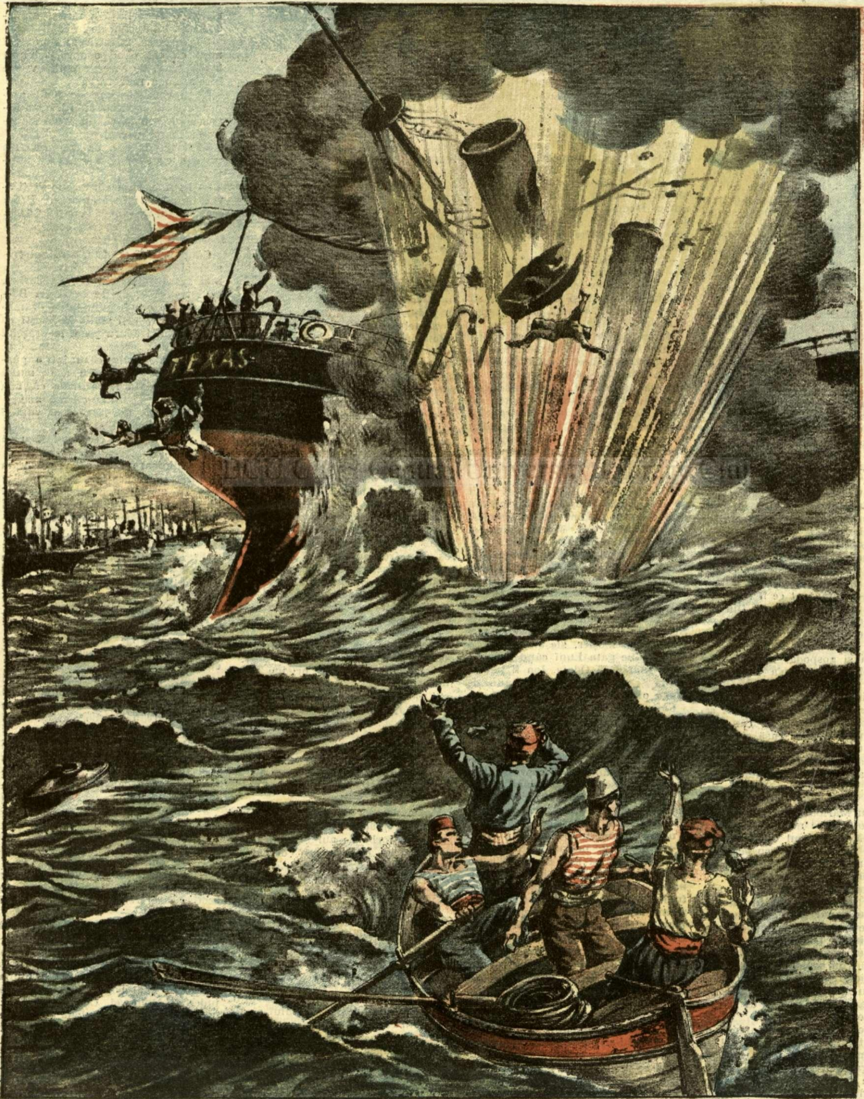
CATASTROFA VAPORULUI „TEXAS“. — (Vezi explicația).

ANUNȚURI: — Linia pe pagina 7 și 8 20 bani —