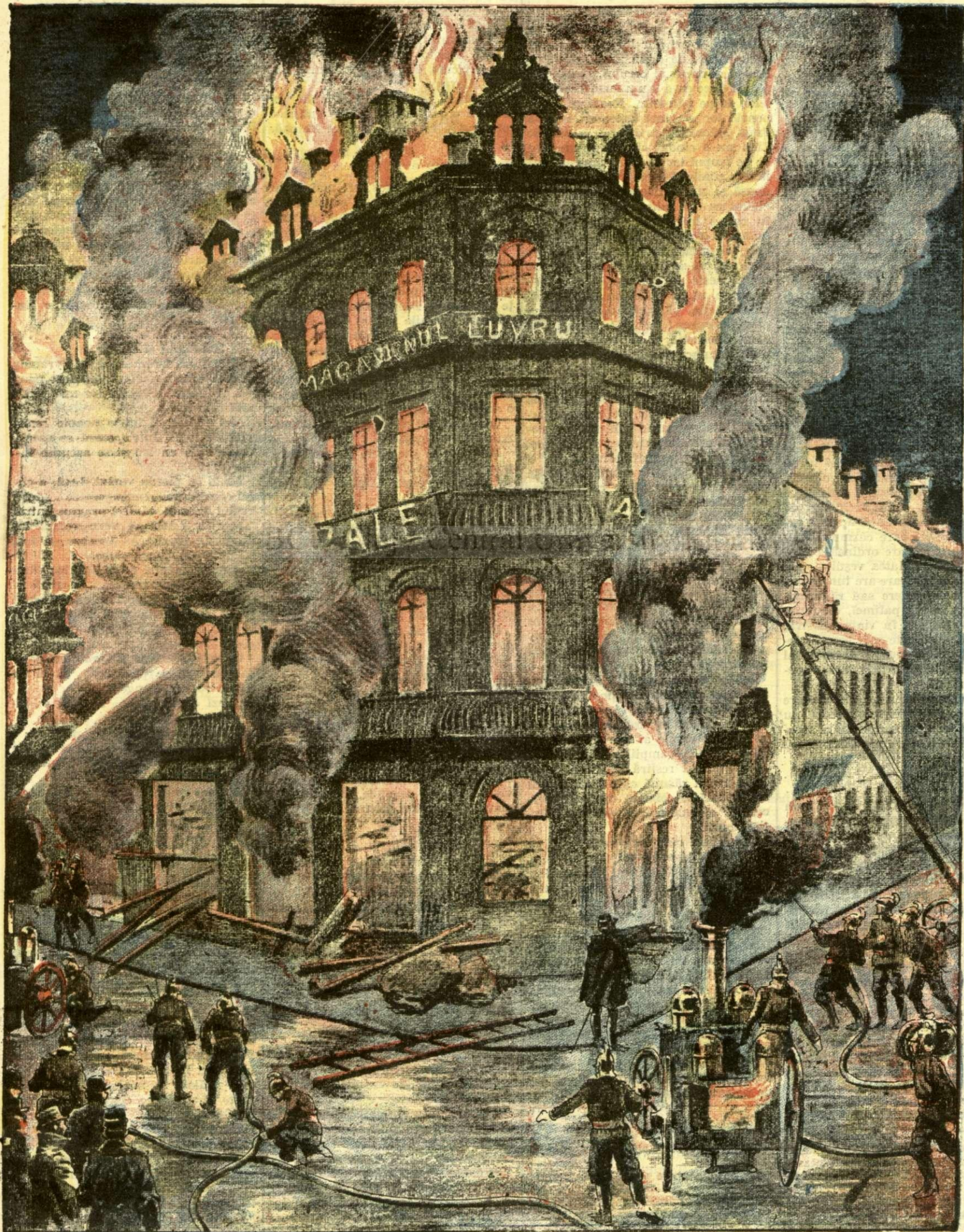
Marele incendiu de la magazinul „Luvru“ din Capitală. — (Vezi explicația).