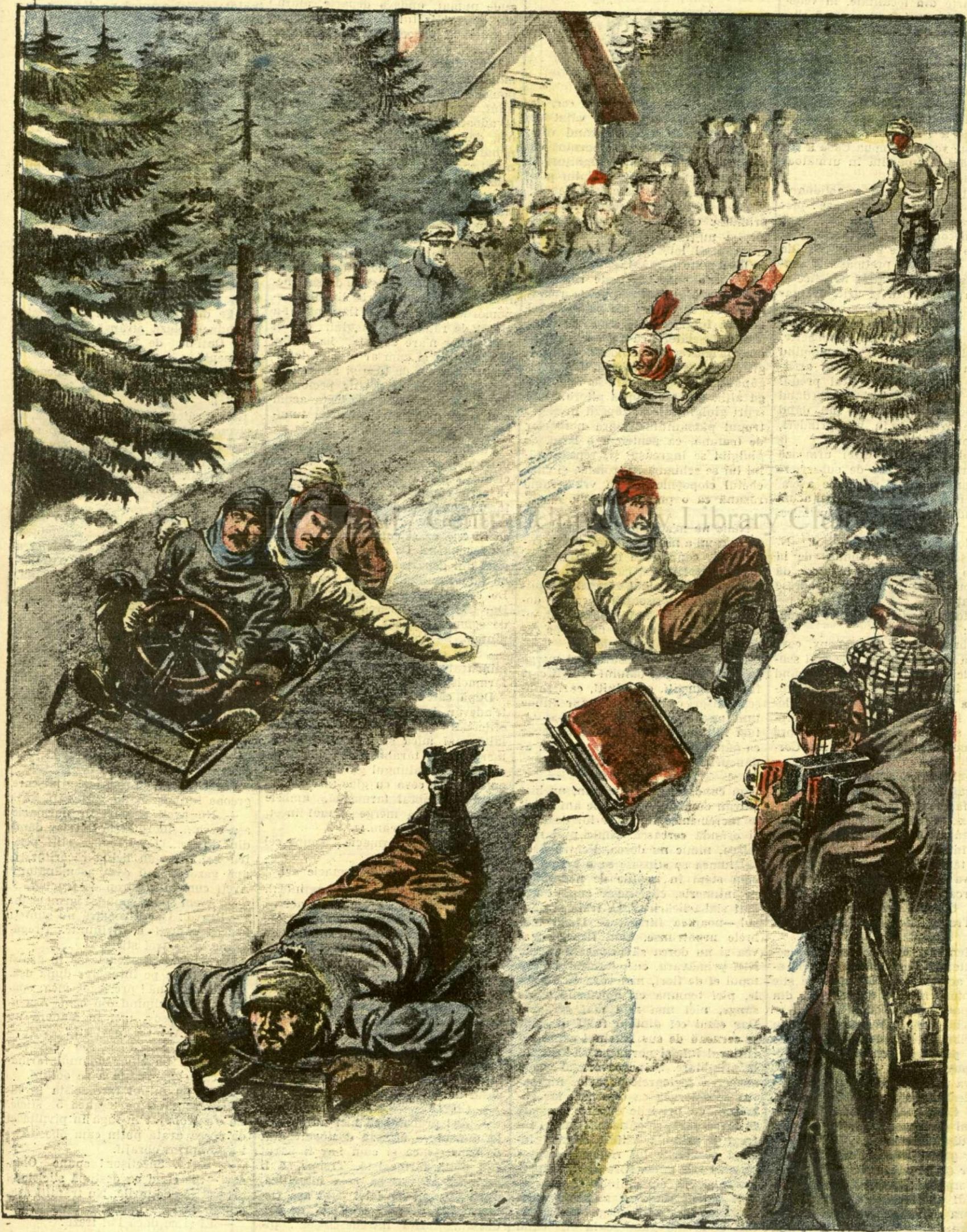
CURSELE DE BOBSLEIGS DE LA SINAIA. — (Vezi explicația)